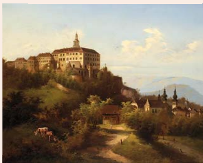
Pohled na Náchod od rakouského krajináře J. Wilhelma Jankowského (1825–1870) z doby kolem poloviny 19. století. Olej na plátně. Národní muzeum.