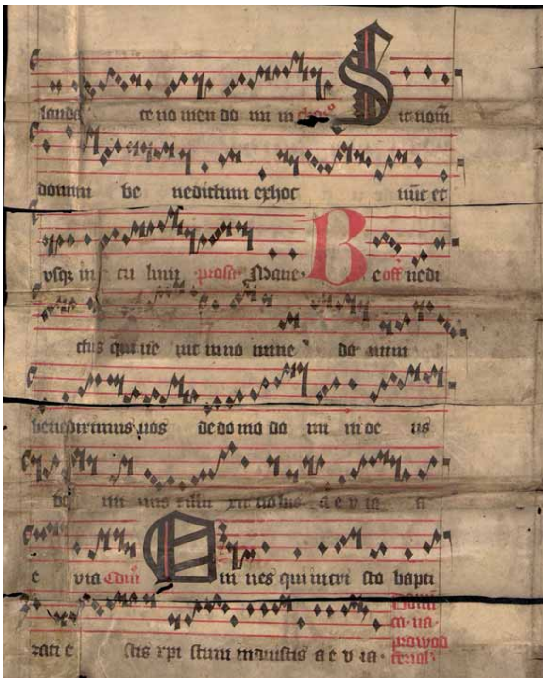
Fragment graduálu s velikonočním repertoárem a českými rubrikami, cca 14. /15. století / Fragment of a gradual with Easter repertoire and Czech rubrics, ca. 14 th / 15 th century NM-ČMH AZ 89/c