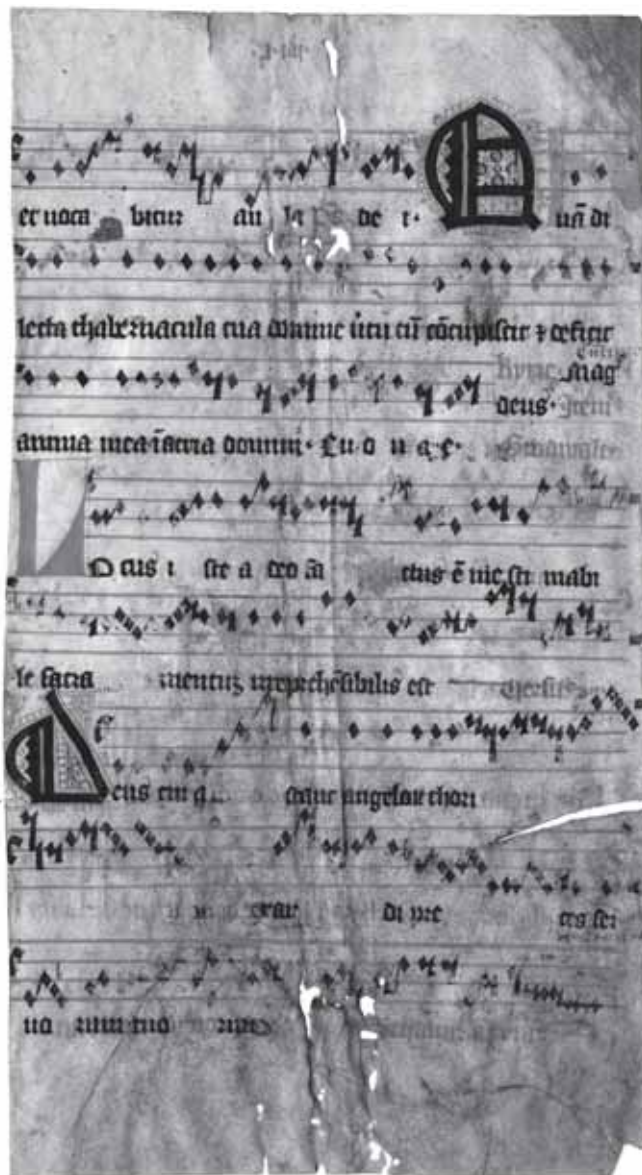
Fragment folia s repertoárem ke svátku In Dedicatione Ecclesiae / Fragment of a folio with the repertoire for the feast day In Dedicatione Ecclesiae