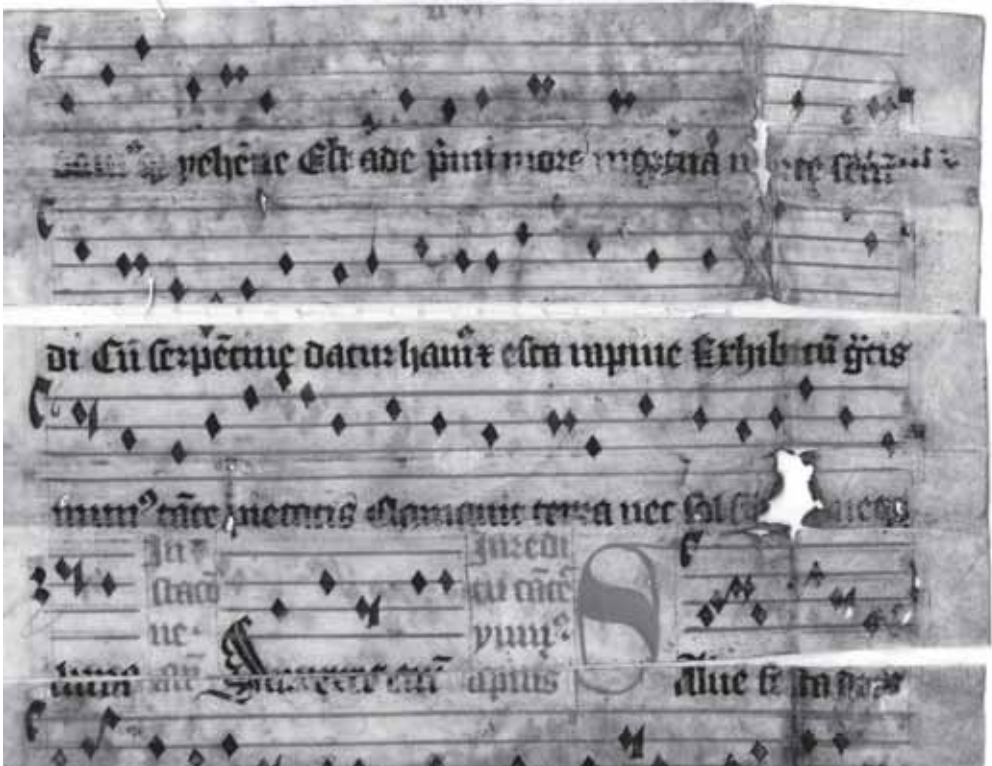
Tropus k antifoně Cum Rex gloriae Christus / Trope to the antiphon Cum Rex gloriae Christus NM-ČMH AZ 89/b, fol. 4 r

1 v : [Al:] Alleluia. Versus. Vox exultationis ... in tabernaculis iustorum [g02386]. Chorus repetit post divisionem hoc ide[?]. Prosa. Adest dies iubilaeus ... de Cristi clemencia. [AH 9, 48, s. 40]