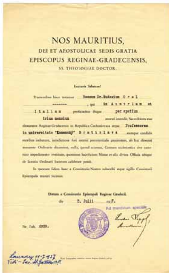
Cestovní povolení od královéhradecké biskupské konzistoře / Travel permit from the Hradec Králové Episcopal Consistory NM-ČMH, pozůstalost Dobrosława Orela, krabice 31-B, inv. č. 51 / the estate of Dobrosław Orel, carton no. 31-B, inv. no. 51