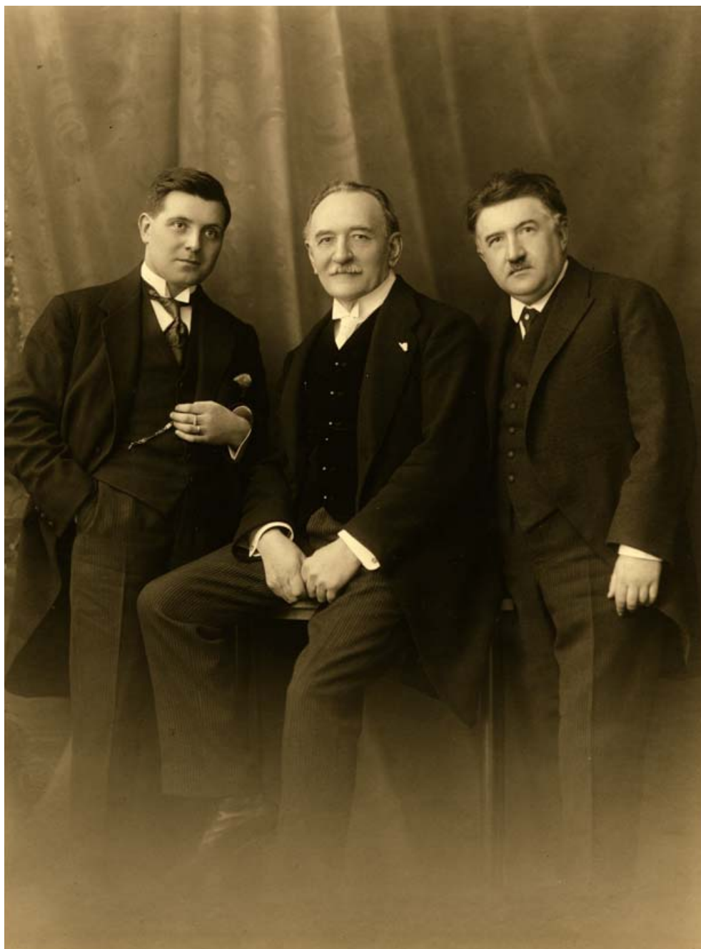
Karel Boleslav Jirák, Josef Bohuslav Foerster a Josef Suk Fotografie / Photograph, Wildt-Prague, 20. léta 20. století / 1920s NM-ČMH, č. př. / Acquisition No. 16/2006