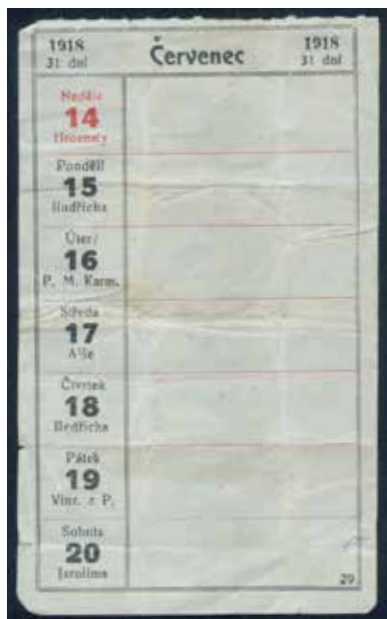
● □ 1: Lístek z kapesního kalendáře z roku 1918:

V obálce byl kromě zmíněných mincí ještě vložen lístek vytržený z kapesního kalendáře, původně dvakrát přeložený a poněkud pomačkaný, na kterém jsou patrné stopy kruhového obvodu pražského groše, jako nejrozměrnějšího exempláře původního obsahu. 3 Na přední straně lístku jsou v běžné úpravě dobového rastrování černým tiskem vyznačeny časové údaje (s výjimkou neděle, kdy je číslice červená) pro 29. týden července roku 1918 (tj. od 14. do 20.). V rubrikách pro případné poznámky žádný rukopisný záznam nenachází-