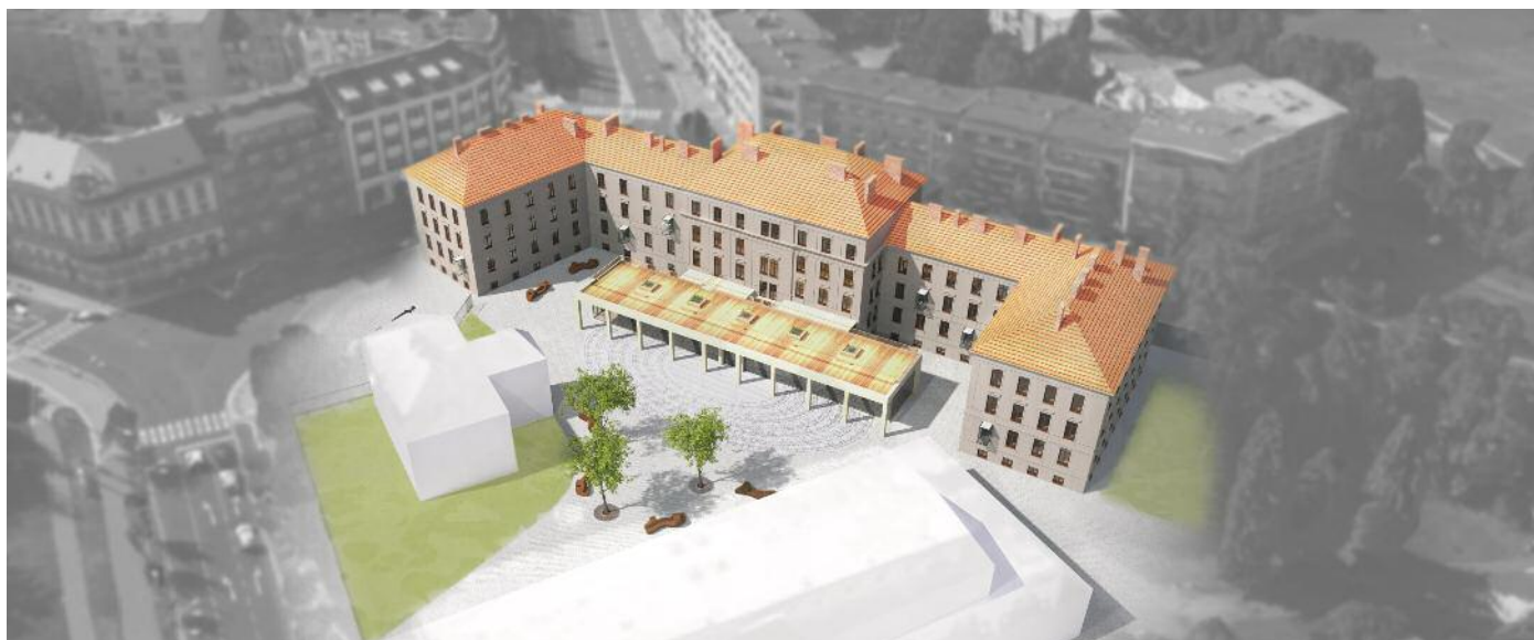
Obr. 3: Nové přírodovědecké muzeum Muzea východních Čech v Hradci Králové – vizualizace pracovní verze.

Využívat, co máme. Paralelně se vzdělávacím probíhalo prokazování souladu projektů muzea ve všech příslušných strategiích – města, kraje a celé Hradeckopardubické aglomerace a postupně se měnilo zadání a rozsah záměru. Zatímco v první fázi projektování, které řídil odbor investic Krajského úřadu Královéhradeckého kraje, vznikl návrh přístavby objektu pro novou expozici, zveřejněná výzva IROP s definicí jasných pravidel a současně možnost využít v areálu Gayerových kasáren také druhou, identickou, více než dvacet let nevyužívanou kasárenskou budovu, přinesly do projektu novou dimenzi a příležitost. V dalším procesu projektování došlo na začátku roku 2016 k rozdělení původního záměru na dva projekty s možností využití integrovaných operací až k postupnému nárůstu na projekty tři.