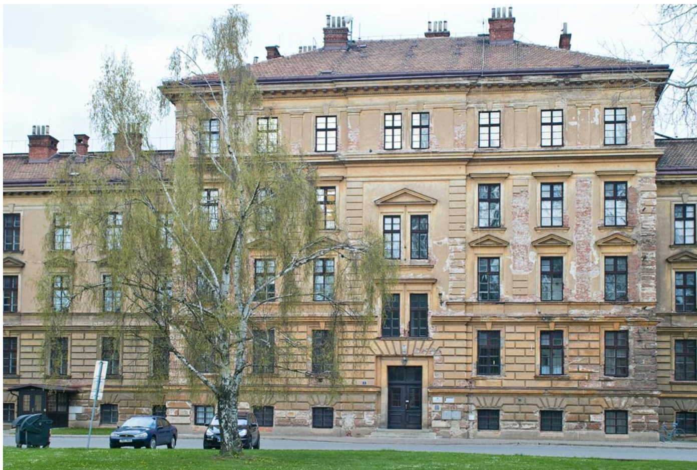
Obr. 2: Stávající podoba depozitáře Muzea východ- ních Čech v Hradci Králové.

majetek převeden na Královéhradecký kraj. Původně kasárenský objekt, postavený v roce 1898, si svůj charakter místa, které není určené pro veřejnost, vytváří bariéru v prostoru a není uživatelsky, návštěvnický ani pracovní příznivé, udržel až do současné doby. Za téměř čtvrtstoletí neproběhla žádná výrazná rekonstrukce, která by muzejní budovu přiblížila standardům oboru a zajistila efektivní uložení sbírky. Částečná výměna oken, vybudování osobního výtahu a dílčí úpravy v objektu byly jediným zásahem do budovy. Sběrka byla uložena bezpečně, ne však optimálně nebo efektivně. Některé části, např. chlazený depozitář pro fotoarchiv, jsou za hranou životnosti. Budova je pro veřejnost, zejména badatelskou, přístupná pouze po předešlé dohodě a v režimu depozitárním. Na konci devadesátých let vznikl plán na přestavbu plně klimatizovaného depozitáře, který využíval podkrovní prostor, naštěstí však nebyl realizován. Náklady na provoz by v současné době muzeum a kraj zbytečně a neúměrně zatěžovaly. Od počátku plánování v roce 2013 bylo hledáno udržitelné řešení projektu a tato linka byla prioritní a nosná po celou dobu příprav. Projekt byl konzultován napříč muzeem, do procesu byl také