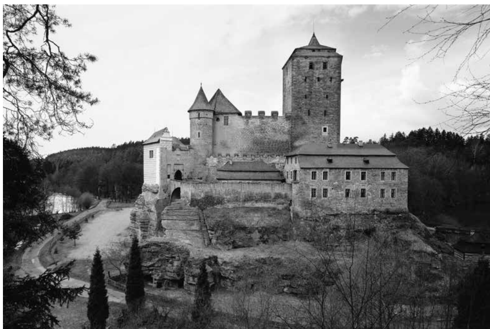
●□1: Hrad Kost.