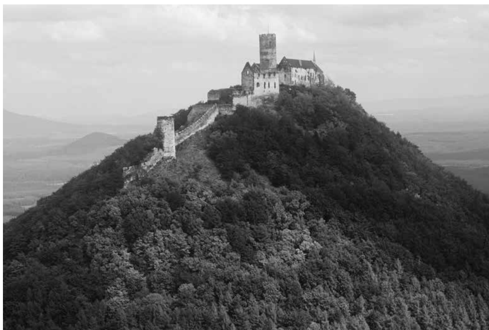
●□2: Hrad Bezd z.