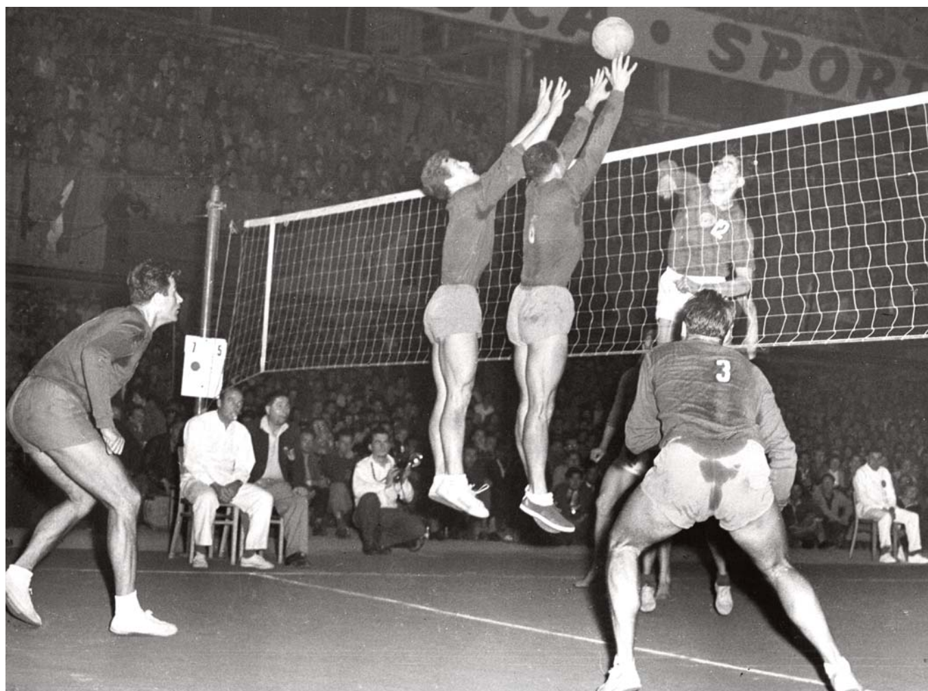
Z finálového utkání na Mistrovství Evropy ve volejbale mužů mezi týmem ČSR a Rumunskem konaného v roce 1958 v Praze.

dolů do stanice. Dlouho jsme nečekali a přijel elektrický vlak. Stálo tam hodně lidí a tak jsme si mysleli, že je necháme nastoupit – velmi jsme se divili, že se tak tlačí v překot. Ale hned jsme dostali vysvětlení, když nám dveře zavřely před nosem a vlak rychle zmizel. On totiž čeká 30 vteřin od zastavení a poté odjíždí, i kdyby bylo venku tisíc lidí a uvnitř volno. Je to nutně, neboť jezdí rychle za sebou v jednodominutových intervalech. Je to něco ohromného. Vlak jezdí rychlostí 70–90 km a má úžasně rychlý start. Hned jede naplno a téměř bezhlučně. Samotné stanice vybudované v hloubce 50–90 m jsou velmi prostorné a krásně vybavené. Samý leštěný kámen, mramor a krásné malby. Všude jsou pojízdné schody, které rychle dopraví nahoru. Je zde jedna okružní linka s 12 stanicemi a další tři, které je protínají. Stojí 50 kopějek. 27 Své postřehy komparuje se svými znalostmi z literatury a z médií. Porovnává stav životní úrovně a konstatuje, že značná podobnost mezi naší a navštívenou zemí je. „Stojí se fronty stejně jako u nás, ale zboží je dražší a obchody ještě hůře vybavené.“ 28 Zaznamenává si i překvapení z množství