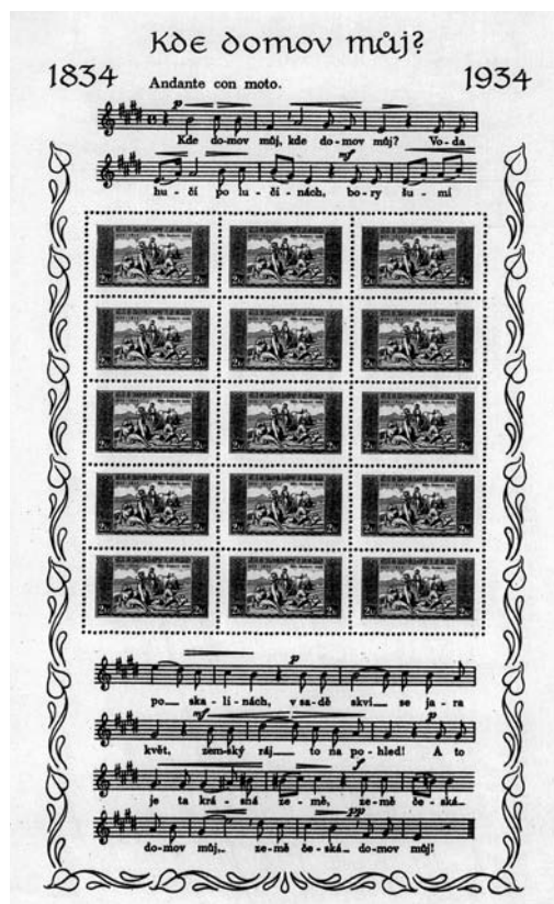
Ukázka z publikace Státní hymna české republiky [...] / A sample from the publication The Czech Republic's national anthem [...]

Soupis publikací je řazen v rámci jednotlivých oblastí abecedně dle příjmení autorů, resp. dle názvů, pokud publikace hlavního autora nemá. Záznamy jsou vytvořeny podle normy ČSN ISO 690 Bibliografické citace. Do citací pouze česky tištěných publikací byly vloženy anglické překlady jejich názvů, které jsou uvedeny v hranaté závorce odlišným typem písma.