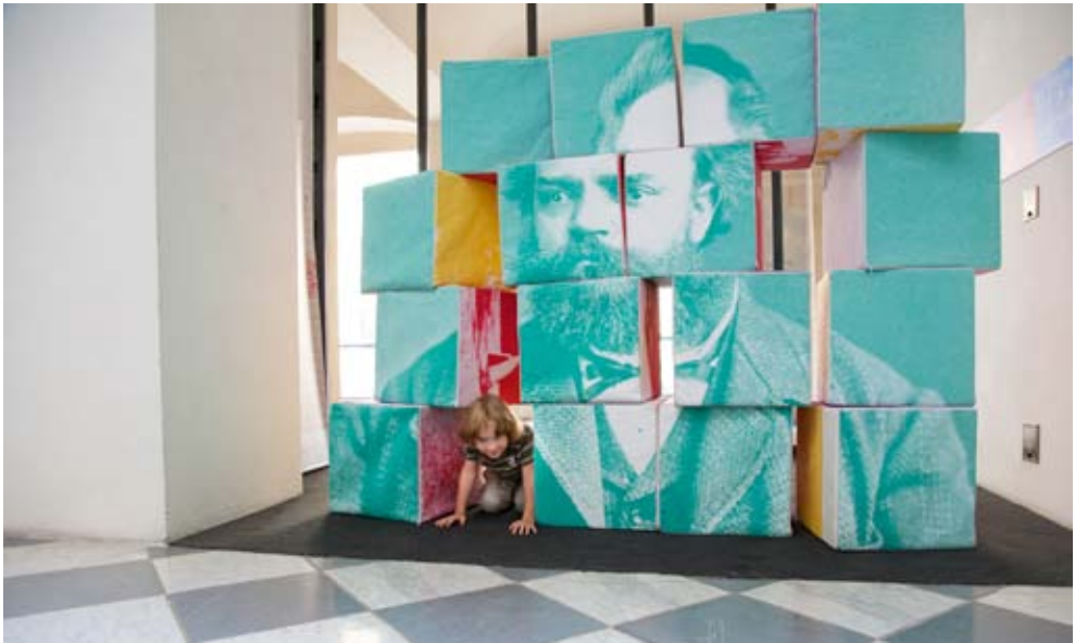
Výstava Antonín Dvořák / The Exhibition Antonín Dvořák „Slož si fotografii Antonína Dvořáka!“ – interaktivita pro děti / / 'Put Together a Picture of Antonín Dvořák!' – interactive fun for children