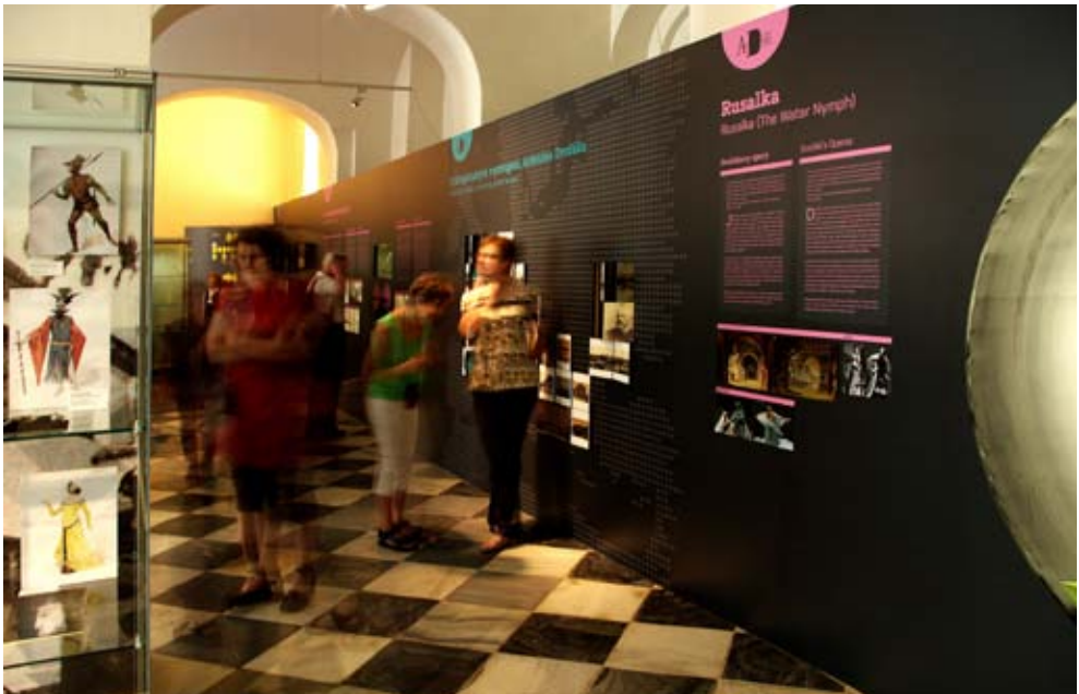
Výstava Antonín Dvořák / The Exhibition Antonín Dvořák Pohled do výstavního prostoru: stěna jako jednotící prvek / / View into the exhibition space: wall serving as a unifying element