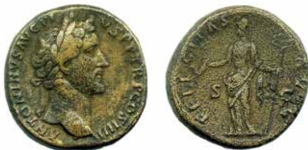
●□2: Mosazný sestercius Antonina Pia.

V oblasti mincovnictví během Antoninovy vlády neproběhly žádné významné změny. Za jeho dlouhé vlády byly početně raženy všechny obvyklé zlaté, stříbrné a bronzové (měděné) mincovní nominály s pestrým výběrem rubních námětů, které se v poměrně dobré zachovalosti a relativně velkém množství dodnes dochovaly v muzejních i soukromých sbírkách a jsou proto vděčným a oblíbeným sortimentem pro sběratele císařského Říma. Obzvláště početné denáry a sestercie nesou charakteristický Antoninův portrét s podlouhlým měsícovitým obličejem a klidným výrazem ve tváři, který je právě tak snadno rozpoznatelný i na otřelých ražbách bez čitelných opisů. 4 Nejen na zahraničních, ale i v našich domácích sběratelských aukcích se lze výjimečně setkat s vysoce vzácnými Antoninovými mincovními typy. Příkladem může být např. vysoce vzácný zlatý \frac{1}{2} aureus s motivem bohyně Minervy. 5