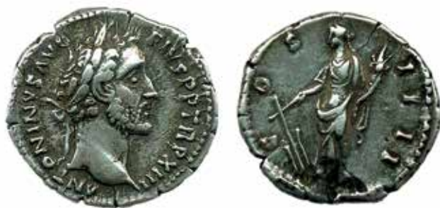
●□1: Portrét Antonina Pia na jeho denáru.

Antoninus Pius se narodil 19. září roku 86 v latijském Lanuviu. Jeho rodina pocházela z jižní Galie z Nemausu (dnes francouzské Nimes), kde děd i otec zastávali konzulské úřady. O Antoninovo vzdělání se starali oba dědové, protože mu otec záhy zemřel. Někdy před 30. rokem věku se oženil s dcerou Marka Annia Vera Anníí Galeríí Faustinou (starší). Věren rodinným tradicím se Antoninus Pius stal v roce 130 konzulem, záhy nato jej císař Hadrianus (117–138) jmenoval soudcem pro Etrurii a Umbrii a v letech 133–136 pak prokonzulem v Asii. Když v lednu 138 zemřel císařův adoptivní syn a předpokládaný nástupce Lucius Aelius, rozhodl se Hadrianus pro Antonina a 25. února jej adoptoval za syna spolu s udělením úřadu tribuna lidu. Také Antoninus si záhy přizval k moci dva mladé vojevůdce Marka Aurelia a Lucia Vera.