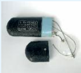
Osobní předměty z pozůstalosti Karla Tomana: dioptrické brýle s pouzdem, hedvábná vázanka z Paříže, stříbrné hodinky zn. Doxa a manžetové knoflíčky uložené v krabičce od zápalek.