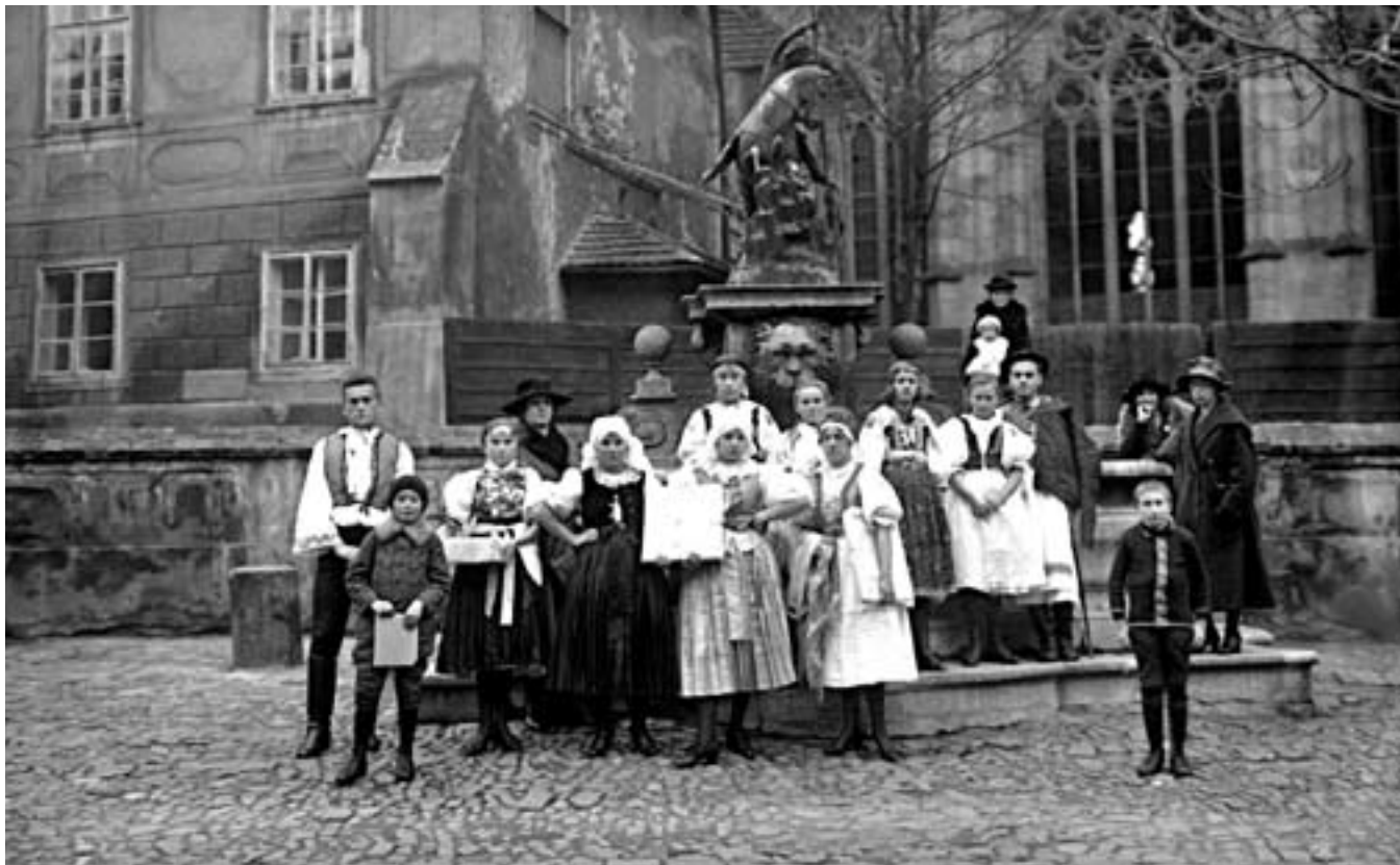
73. Neg. 1904: 27. říjen 1922, skupina slovenského dorostu Československého červeného kříže při návštěvě prezidenta Masaryka na Pražském hradě. Lidé oděni do svátečních krojů s tradičními dary panu prezidentovi na hradním nádvoří před sochou sv. Jiří.