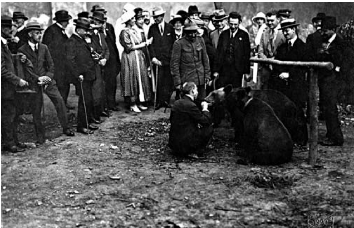
108. P1431-1920: 23. květen 1920, návštěva anglických žurnalistů v Praze. Hosté si v doprovodu Alice Masarykové prohlížejí medvědice.