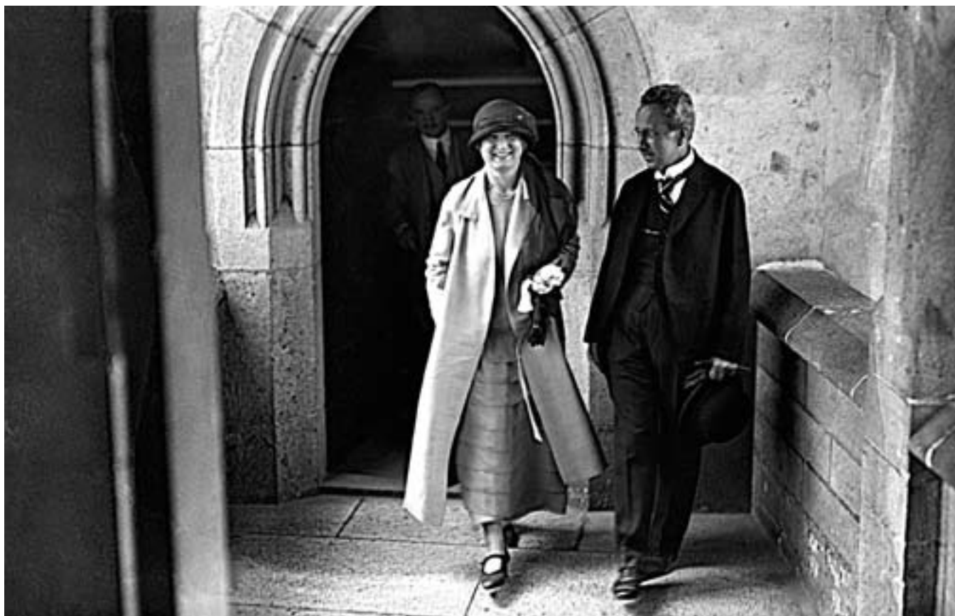
91. Neg. 3179: 14. červenec 1924, zájezd představitelů Malé Dohody na Karlštejn (Hana Benešová).

válce se to všechno, co pro ni dříve bylo jen samozřejmostí z vlastní vůle, stalo nezbytnou součástí života. Najednou vedla po boku Beneše pestrý společenský život. Ještě v prosinci roku 1918 jí psal z Paříže: „... Připrav se ovšem na to, že budeš reprezentovat: dávat diner et déjeuner, chodit na diner a déjeuner k ministrům, vyslancům, prezidentu atd. atd. Je to strašná obtíž a robota, ale musím to dělat. Všecky věci, toalety, přípravy atd. se zařídí zde. Moc bát se toho nemusíš, člověk se do toho vpraví rychle... “. 109