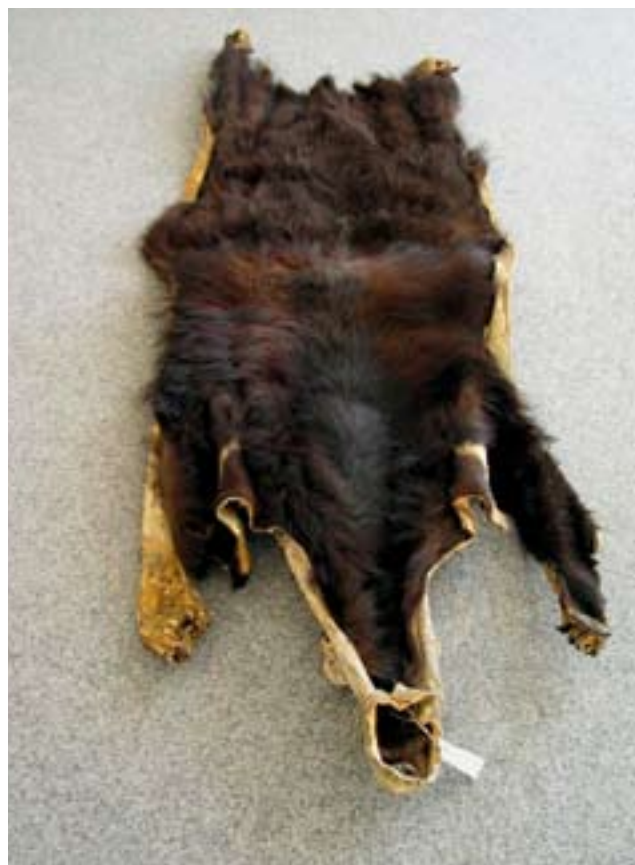
116. Kůže medvěda ušatého, NM, evid. č. P6V 11 970.

Prague Castle bears in the National Museum collections The Zoological Department of the Museum of Natural His-