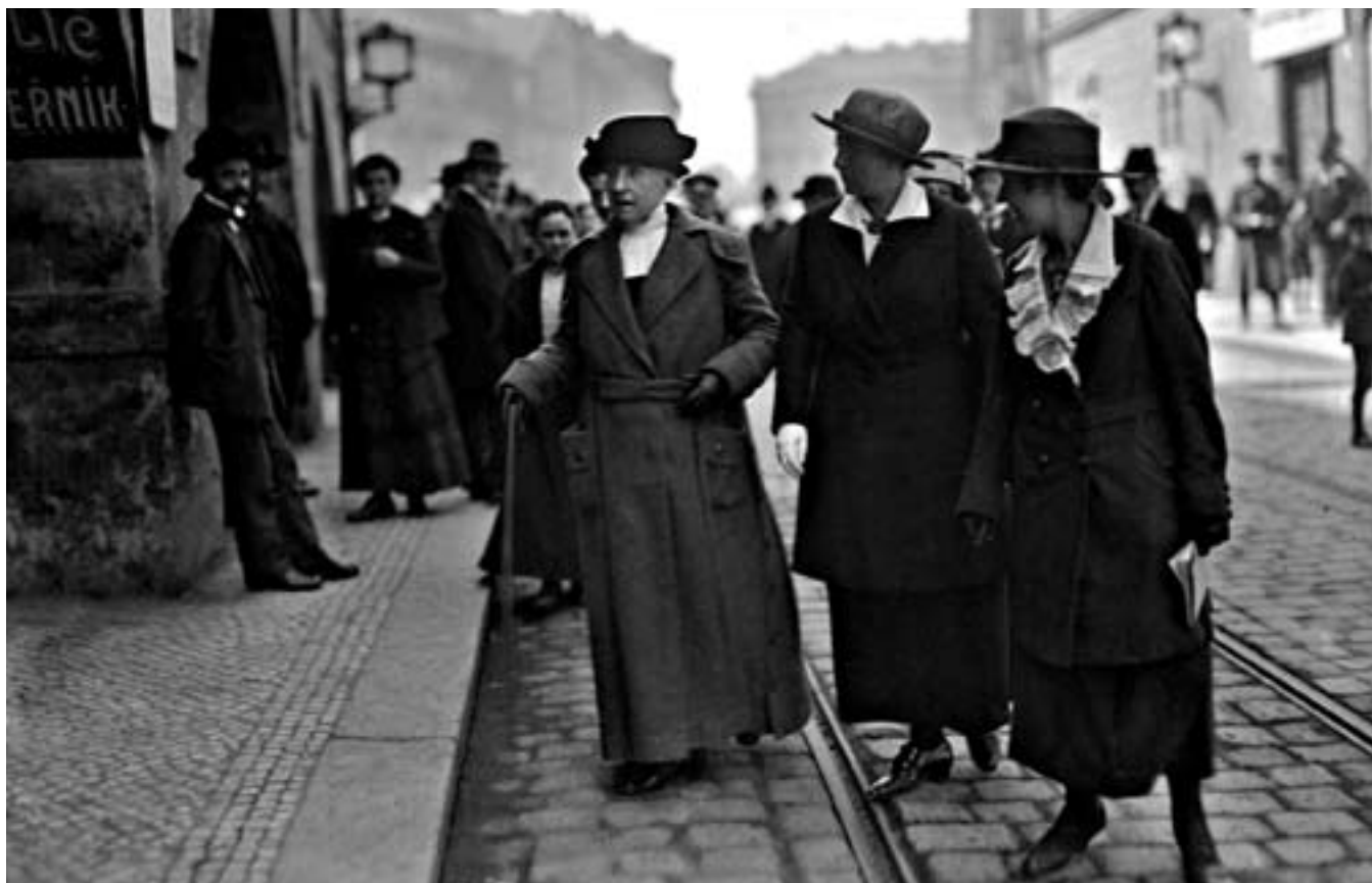
83. Neg. 222: 18. duben 1920, volby do poslanecké sněmovny (Charlotta Garrigue Masaryková, Alice Masaryková).

letní komplety výraznými klobouky. Jediná nepřišla bez této ozdoby hlavy. Velmi vkusný malý tmavý klobouček zvolila ke světlému pláští téměř pánského střihu i Charlotta Masaryková. Dámy mladší popustily uzdu fantazii intenzivněji a na jejich hlavách se objevily kreace s květinovými girlandami či našasenými stuhami. Ženy sedící v řadách s nejlevnějšími vstupenkami se ozdobily alespoň slamáky a klobouky ovinutými jednoduchou stuhou. Byl to první sokolský slet ve svobodném Československu a Sokolstvo bylo průkopníkem a propagátorem československého národa, jak již bylo zmíněno v souvislosti se sletem v roce 1912. Ženy z venkova často dorazily v kroji, tak typickém pro první léta po vzniku státu. Oblíbené byly i dvojdielné komplety inspirované lidovým oděvem, většinou ve světlém tónu, zdobené vyšívanými vsadkami, či halenky s lidovou výšivkou. Tu často najdeme především na oděvu žen z obsluhujícího personálu sletu, jako byly kuchařky.