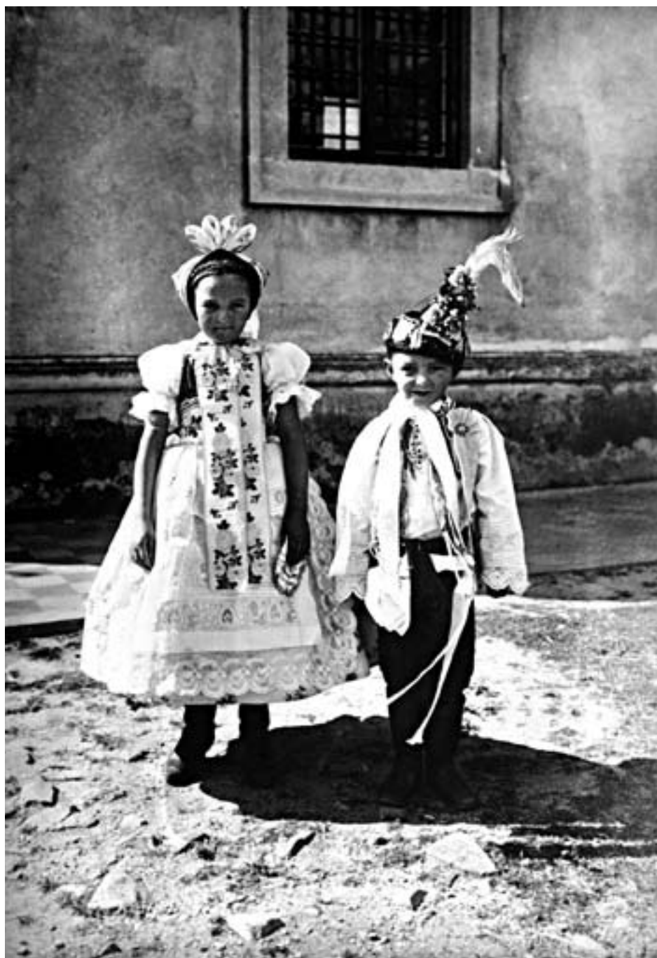
71. Neg. 86: Rok 1919, děvčátko a chlapec v jihomoravských podlužáckých krojích. Dokumentační snímek dětí v dobově pojatých svátečních krojích z obce Chorvatská Nová Ves.