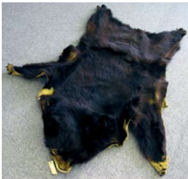
115. Kůže medvěda ušatého, NM, evid. č. P6V 11 971.

krku a na lopatkách měří asi 10 cm. Ve zbarvení převládá černý odstín s prosvítající tmavou podsadou, žlutavá kresba ve tvaru V na prsou je rovněž dobře patrná. Podrobnější ohledání kůže nepřineslo žádné indicie o pohlaví tohoto jedince. Na podkladě informací o zbarvení nelze u obou jedinců jednoznačně určit poddruhovou příslušnost (podle místa původu přichází teoreticky do úvahy poddruh U. t. ussuricus Heude, 1901 s rozšířením od Poamuří po severovýchodní Čínu a Korejský poloostrov). Stejně tak nelze identifikovat, která z těchto dvou kůží patřila medvědu „ Vaškovi “ a která „ Máně “, a to ani s pomocí pitevni zprávy o jejich utracení. 15