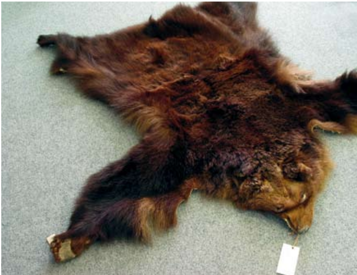
114. Kůže medvěda hnědého („Míša“), NM, evid. č. P6V 11 973.