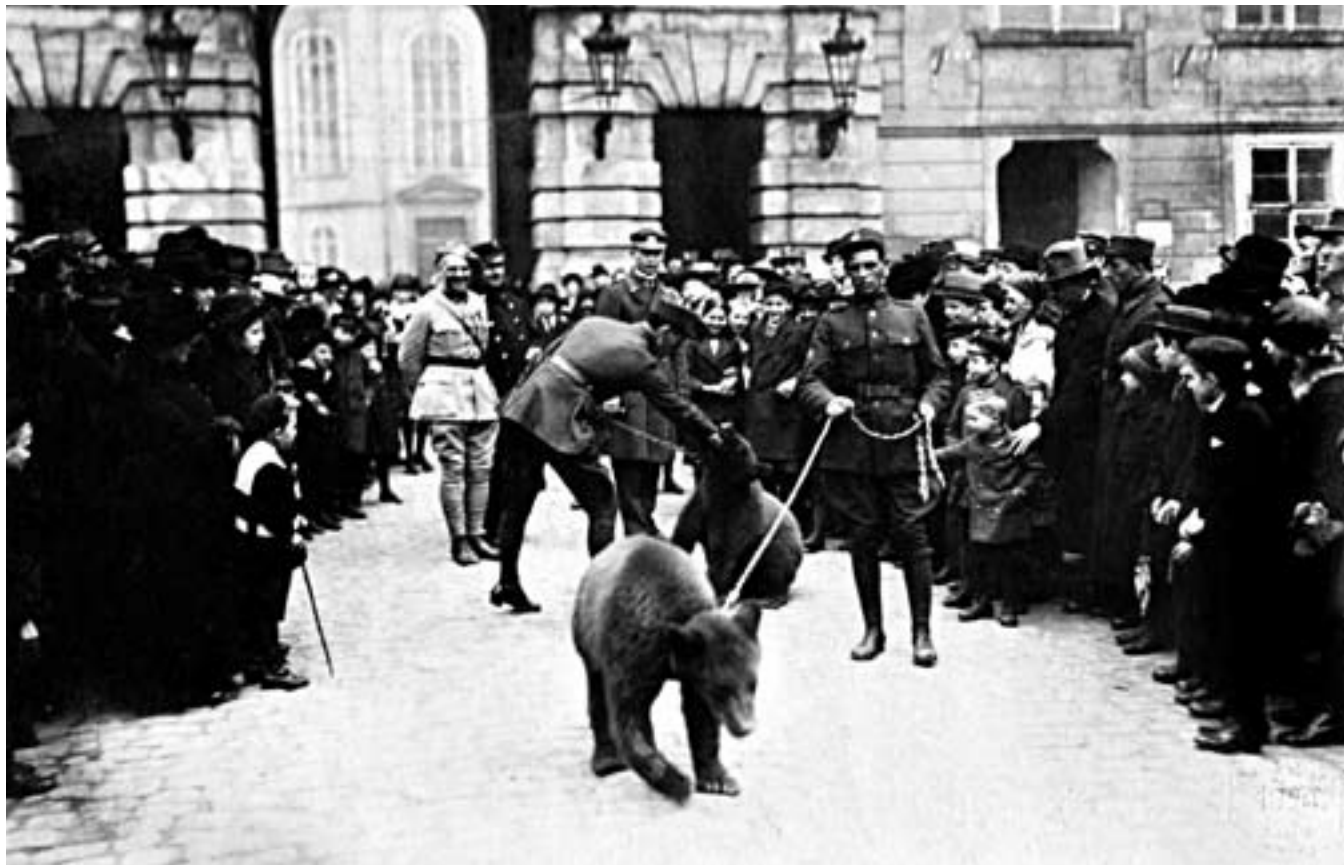
107. P1273-1920: 7. březen 1920, oslava 70. narozenin prezidenta Masaryka na Hradě, medvíďata darovaná prezidentovi eskoslovenskými legionáři ze Sibiře.