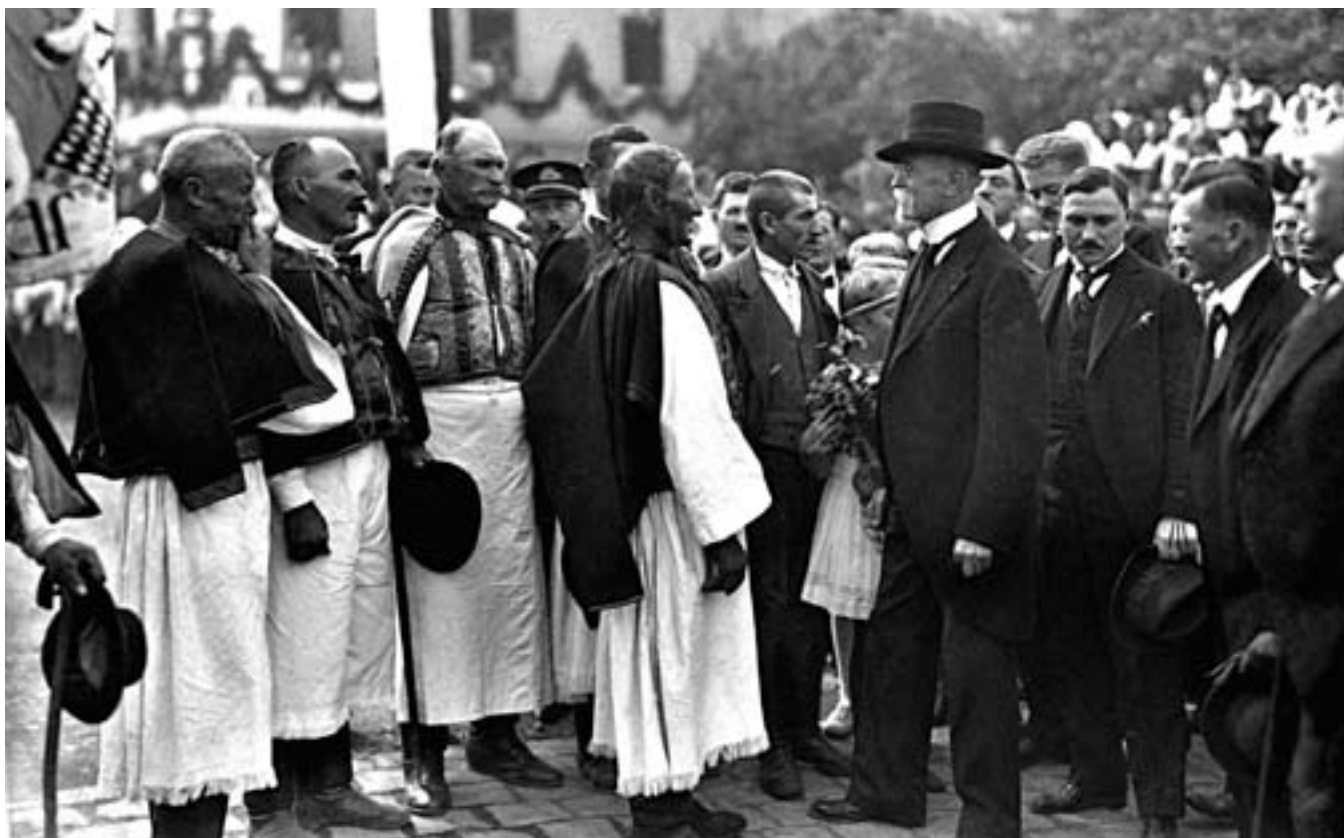
72. Neg. 2497: 25. srpen 1923, cesta prezidenta Masaryka na střední Slovensko do Banské Bystrice. Skupina mužů ve starobylych detvanských krojích.