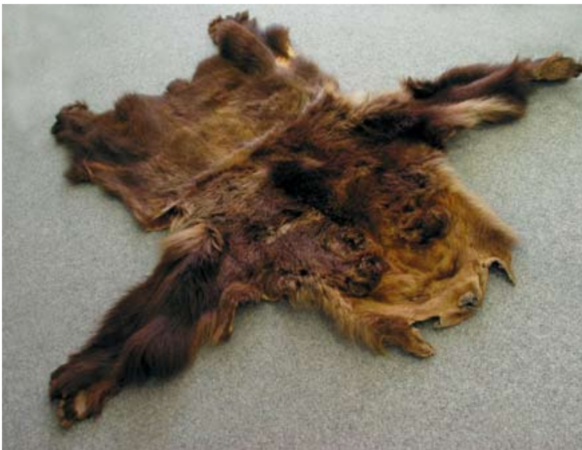
113. Kůže medvěda hnědého („Macek“), NM, evid. č. P6V 11 975.