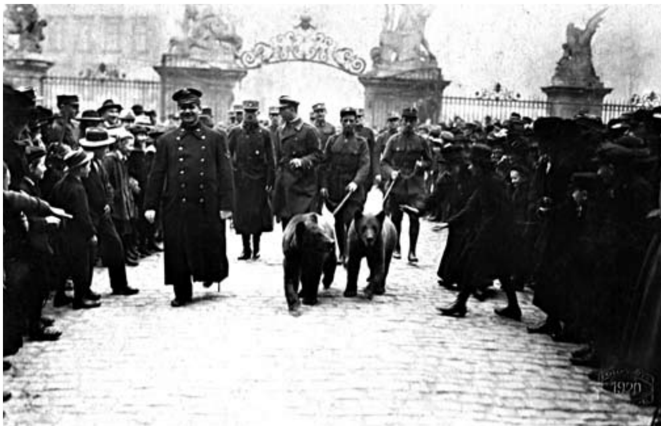
106. P1272-1920: 7. březen 1920, oslava 70. narozenin prezidenta Masaryka na Hradě, medvíďata darovaná prezidentovi eskoslovenskými legionáři ze Sibiře.