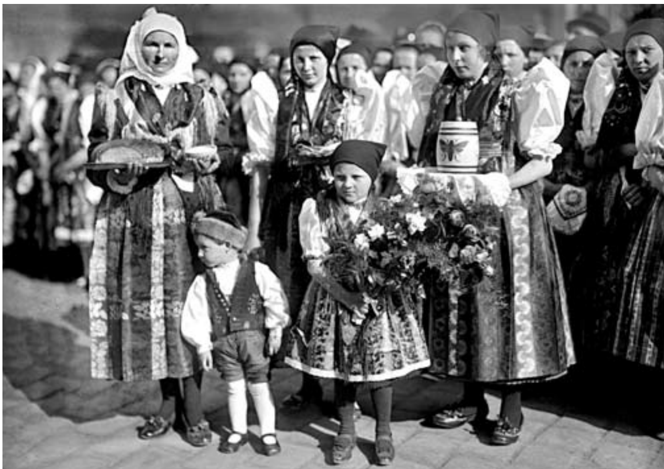
66. Neg. 2177: 3. květen 1923, cesta prezidenta Masaryka do Domažlic. Chodské ženy ve svátečních krojích podávají dobové atributy spojené s vítáním vzácných hostů, chléb, sůl a med.

atmosféru první Československé republiky v souznění jejího národního, společenského i politického potenciálu.