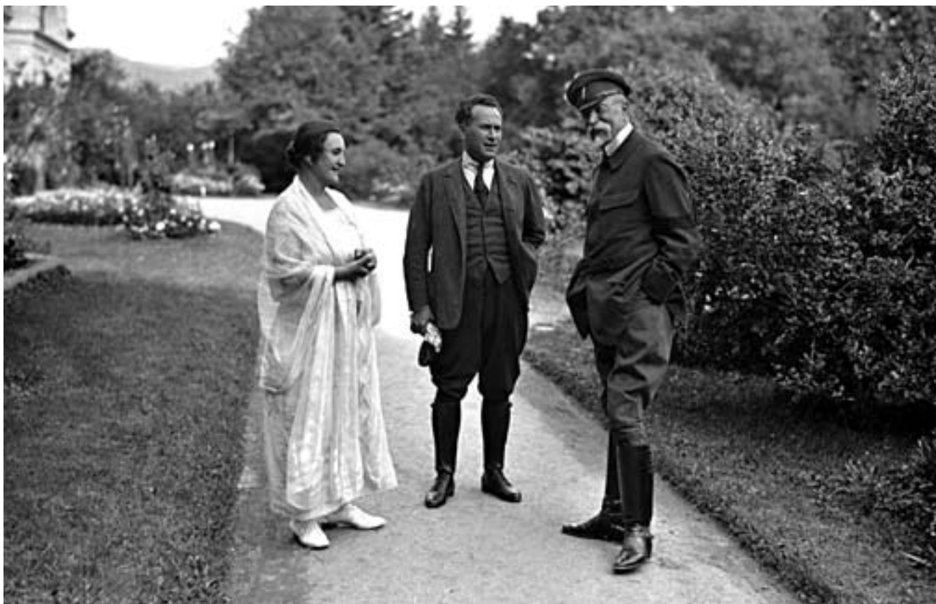
102. Neg. 2309: Srpen 1923, pobyt prezidenta Masaryka v Topoľčiankách (Pavla Osuská, Štefan Osuský, TGM).

Viktorem Hoppem a dalšími na projížďku na koni (neg. č. 2440). Protože neměl holínky, oblékl holenice, rajtky a jednoduché jednořadové sako s bílou košilí. Dokonalý vzor sportovní elegance (neg. č. 2439).