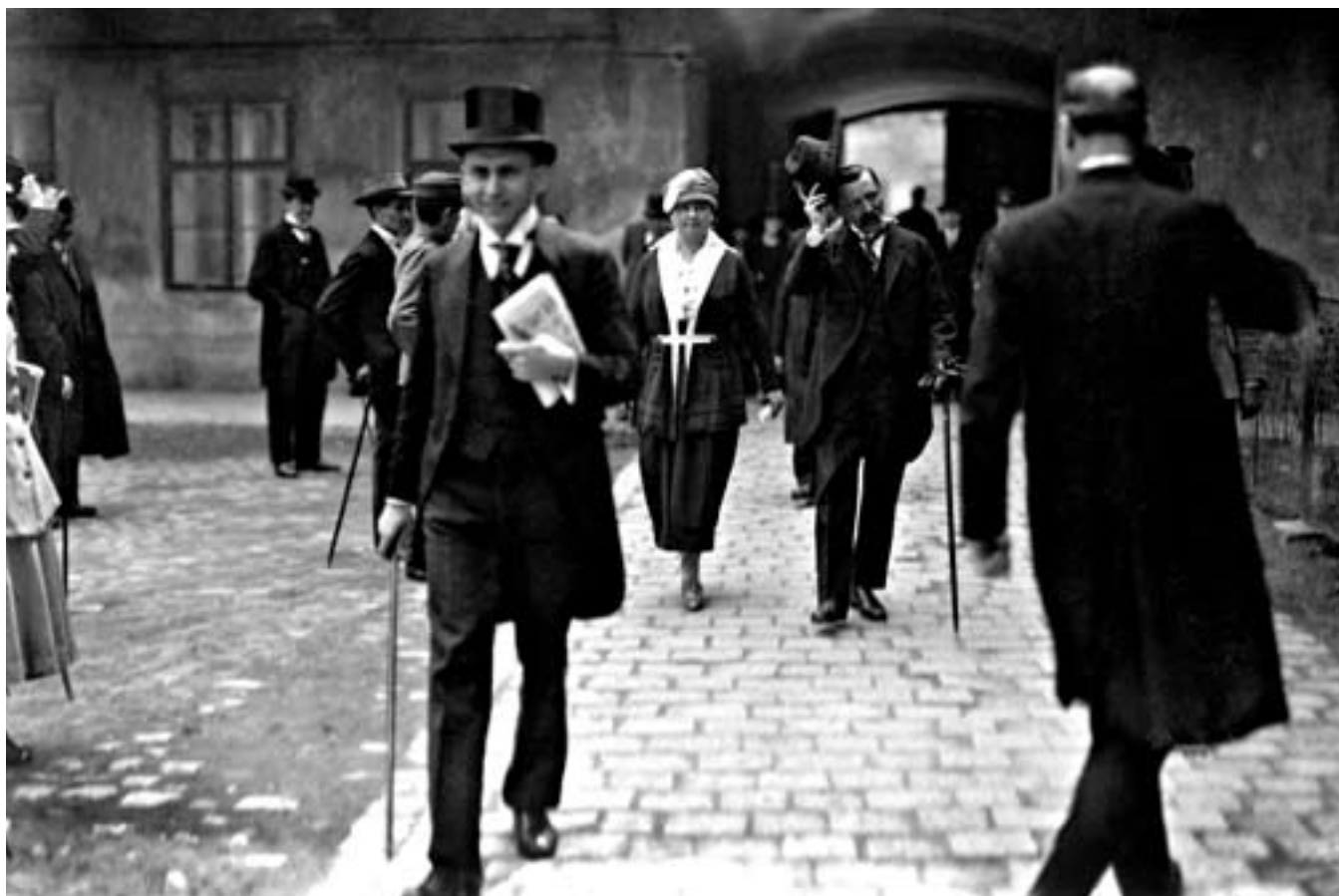
95. Neg. 225: 25. duben 1920, volby do senátu (Vlastimil Tusar, Hedvika Tusarová).