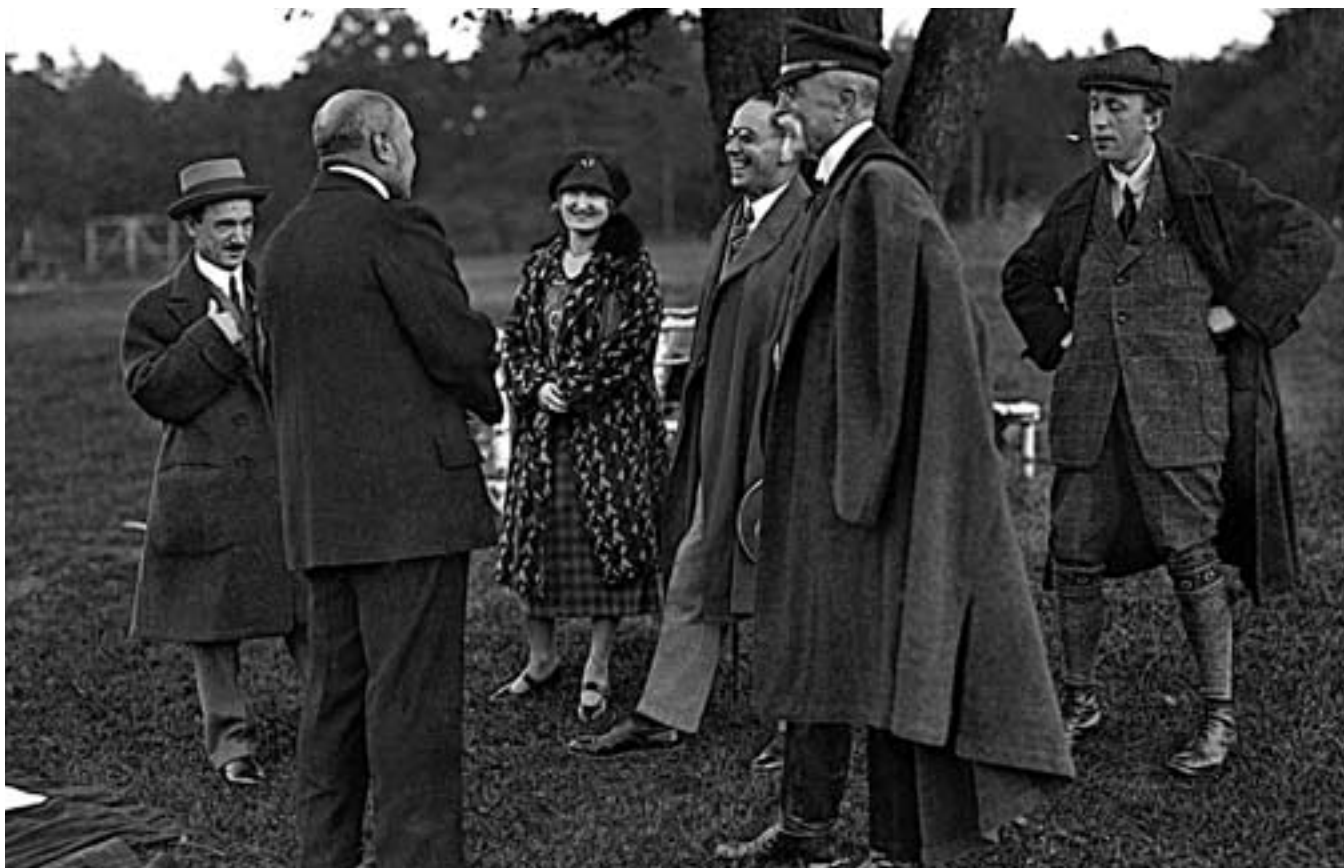
90. Neg. 4483: 28. září 1926, výlet z Topolčianek na Hrušov, piknik pod stromem (Edvard Beneš, Antonín Švehla, Hana Benešová, František Chvalkovský, TGM, Karel Čapek).