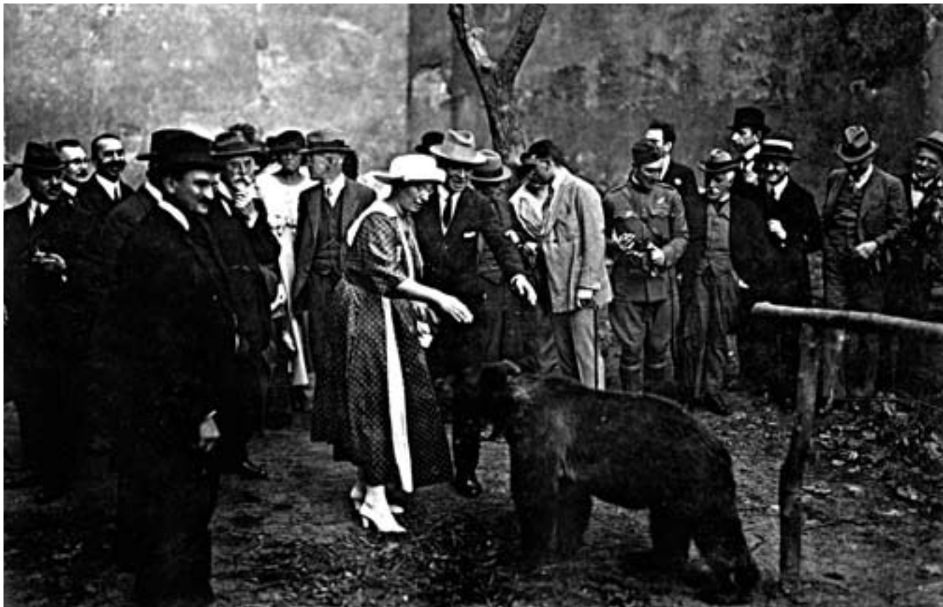
109. P1432-1920: 23. květen 1920, návštěva anglických žurnalistů v Praze. Hosté si v doprovodu Alice Masarykové prohlížejí medvědice.