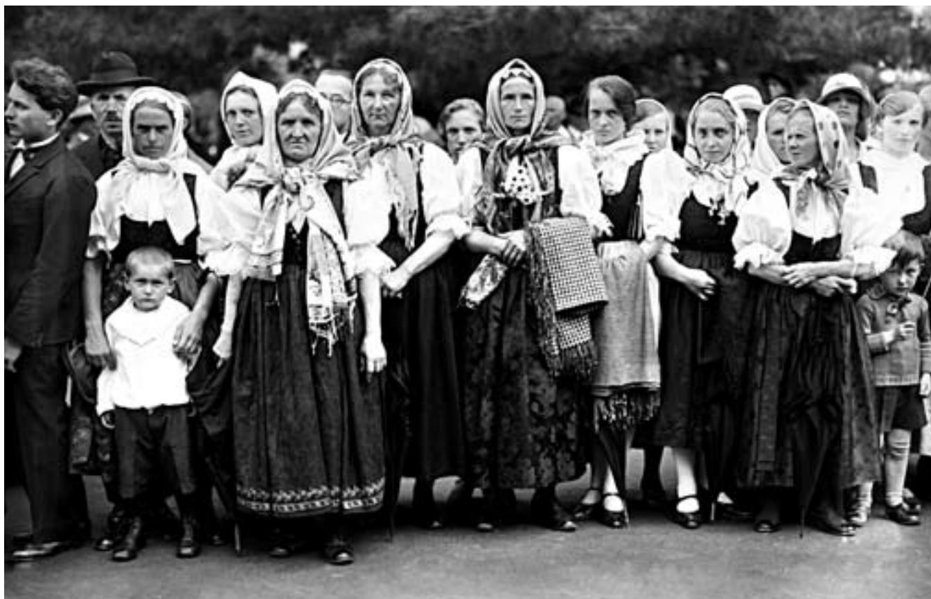
69. Neg. 5551: 24. červen 1928, cesta T. G. Masaryka na Valašsko do Rožnova pod Radhoštěm. Skupina žen v rožnovských svátečních krojích.

nezapomenutelných. Příkladně dvojice dětí ve slavnostních krojích z podlužácké obce Chorvatská Nová Ves, podobně jako celá tamní rodina důstojně usazená přede dveřmi usedlosti. Je zde i několik snímků mládeže, dva chlapci ve slováckých krojích v polosvátečním i slavnostním oblečení, ženy z moravskoslovenského pomezí, ze slovenských obcí Myjava a Bošáca a některé další dokumenty, pořízené již v roce 1919.