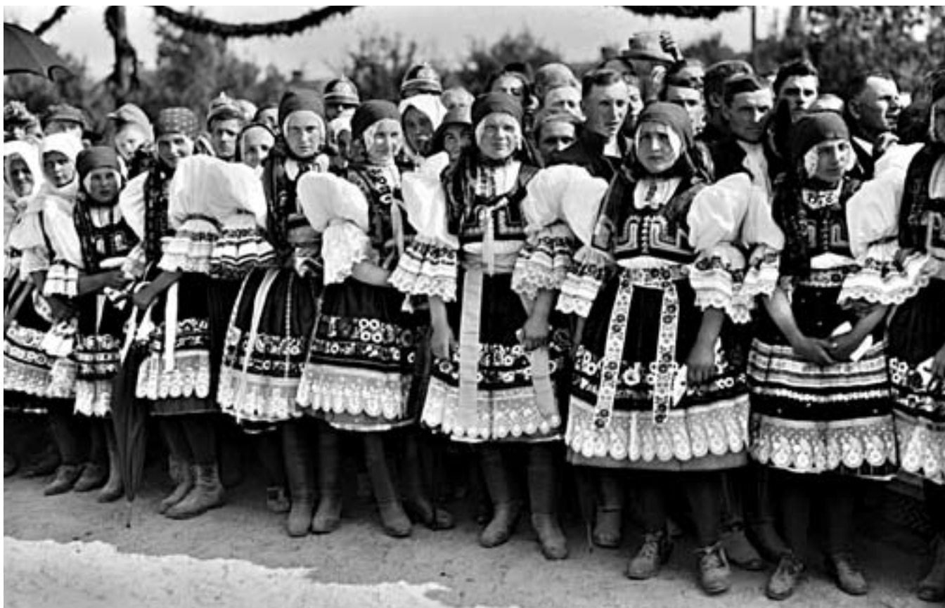
70. Neg. 3144: 27. červen 1924, cesta T. G. Masaryka na Slovákco do města Kyjova. Ženy ve slavnostních kyjovských krojích při vítacím ceremoniálu.

T.G. Masaryk's visits to various parts and regions of the Czechoslovak Republic. Numerous professional pictures document large numbers of people wearing traditional folk attires. To celebrate the visit of the head of their state, people chose to wear traditional local costumes to show their allegiance to both their region and their country. In some regions, notably in the industrialised Bohemia, folk costumes had ceased to be worn for about one century, but folk costumes were still used in other regions, especially in Moravia and Slovakia. South Moravia's southeastern Slovákco region and virtually all of Slovakia liked to wear traditional attire.