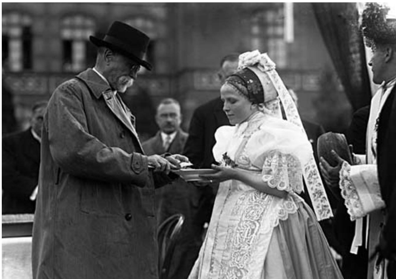
65. Neg. 5473: 20. červen 1928, návštěva prezidenta Masaryka v jihomoravských Valticích. Děvče v podlužáckém kroji vítá pana prezidenta podle dobového zvyku chlebem a solí.

doklad společenských aktivit se zapojením krojového fondu.