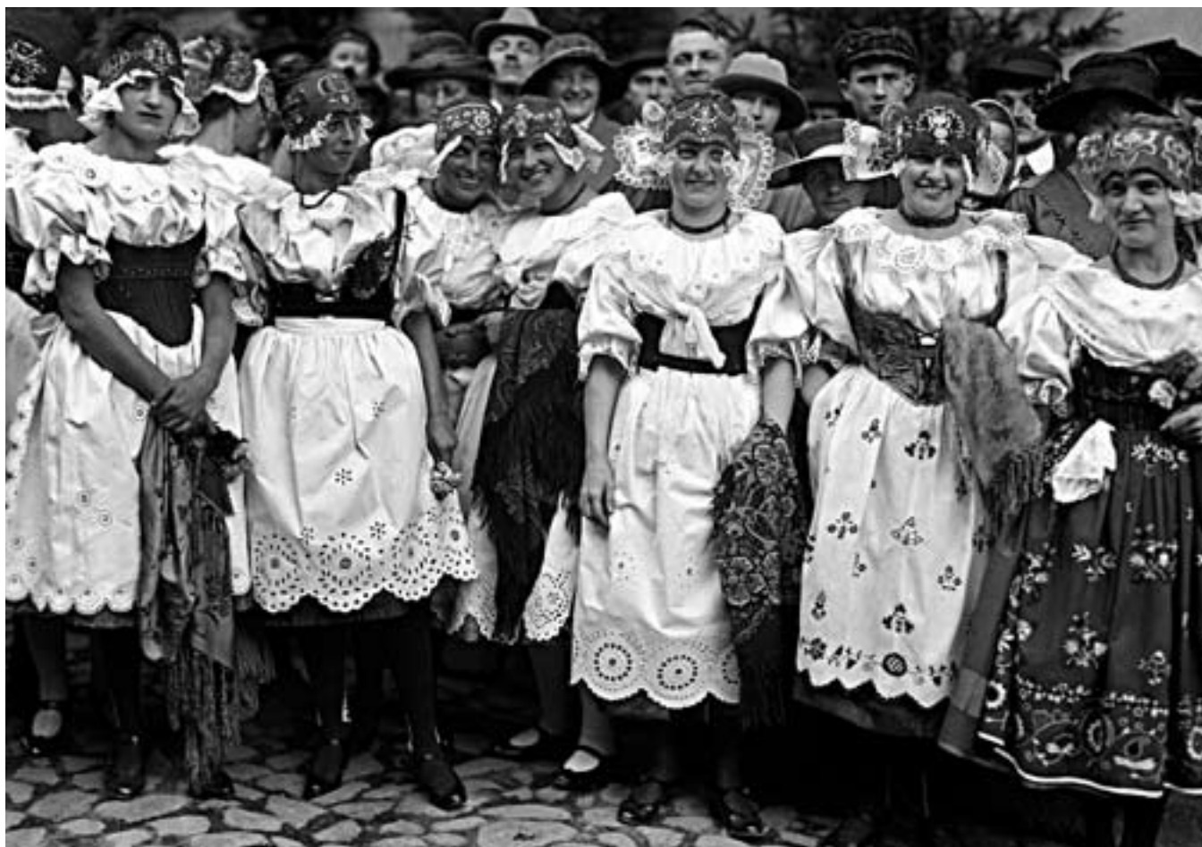
67. Neg. 1774: 17. září 1922, cesta prezidenta Masaryka do Pojizeří. Dívky v obnovených turnovských krojích v Semilech vítají prezidenta. Kroje představují tendence novodobé krojové tvorby, typické v Čechách ve 20. a 30. letech 20. století. Foto Jano Šrámek.

popiska fotografie, s údajem, že jde o kroj městský. Není tomu tak. Na rozdíl od načechraných krojů z předešlého obrázku jde o skutečný obraz tradičního selského ustrojení z Podkrkonoší, tak jak o něm svědčí stovky dokladů v muzejních sbírkách z oblastí Českého Ráje. 3