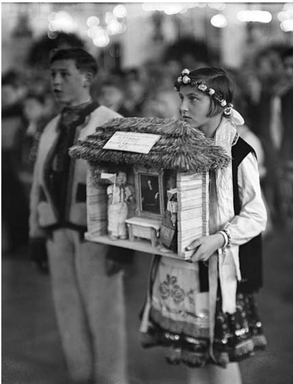
74. Neg. 6601: 2. březen 1930, hold dětí prezidentu Masarykovi u příležitosti jeho 80. narozenin ve Španělském sále na Pražském hradě (zástupci Podkarpatské Rusi).