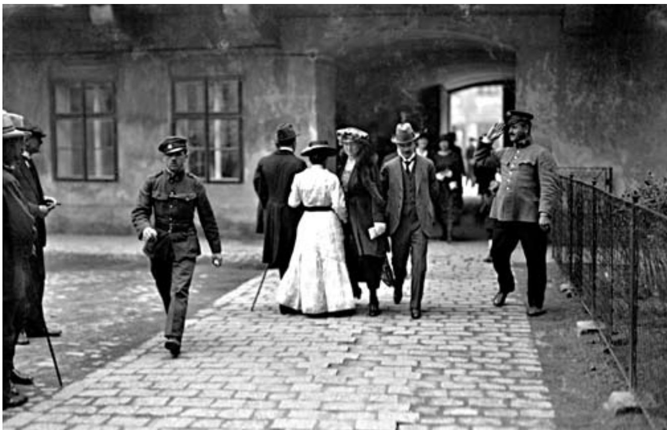
76. Neg. 236: 25. duben 1920, volby do senátu. Edvard Beneš s chotí Hanou Benešovou.