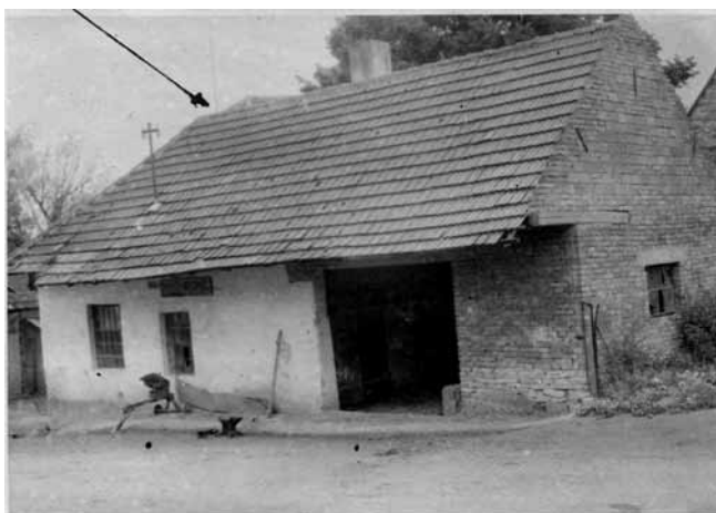
Rumíškova kovárna, ABS.

ké mládeže (dále jen SČM). Kroky obou mužů pak vedly do kurzu traktoristů, kde budoucí oběť školila frekventanty v jízdě. Když ze školení nakonec z prozaického důvodu nic nebylo – ani jeden z traktorů nebyl totiž pojízdný –, vrátili se otec a syn na MNV, přičemž úřad opouštěli okolo 21:30 hodin za úplné tmy: „ Cestou jsme nikoho nepotkali a když jsme se přiblížili k domovním dveřím, zjistili jsme, že pes, kterého jsme měli sebou leží přede dveřmi. “ 2,3