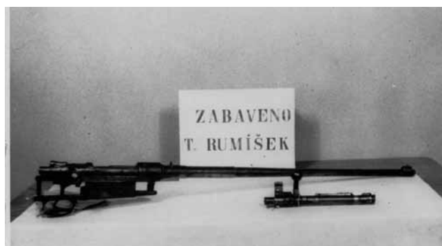
Vražedná zbraň – vojenská puška vz. 24. Veškeré její dřevěné části Tomáš Rumíšek po činu spálil ve své kovářské peci, ABS.

Dne 10. července 1952 se Tomáš Rumíšek konečně dočkal. V noci se u jeho domu objevil neznámý muž, který se javornickému kováři prokázal smluveným znamením a vysvětlil mu, že na následující noc sjednal nákladní automobil, který Rumíška v noci zaveze k hranicím, kde si ho převezme