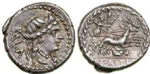
●□ 5: C. Allius Bala, denár 92 př. n. l., RRC 336/1b.

nebyl na typu RRC 222 záměrně umístěn nad hlavu Diany, nýbrž pod kopyta spřežení. Bigu jelenů řídí Diana ještě na dvou výrazně mladších typech denárů z roku 92 př. n. l. 32 (obr. 5) a 70 př. n. l. 33 (obr. 6), žádná z těchto pozdějších ražeb nicméně nenavazuje na ikonografii původního typu RRC 222 v plné šíři – a nápadné je opět především úplné vytěsnění lunárního aspektu v souvislosti s Dianou. 34