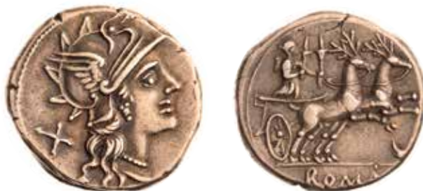
● 1: Vzácná varianta denáru RRC 222/1.

V souvislosti s přípravou souborného katalogu římských republikánských mincí ve sbírkách Národního muzea byla v jednom z dosud nezpracovaných fondů numismatického oddělení identifikována zatím nepublikovaná varianta římského republikánského denáru typu RRC 222/1 (obr. 1), 1 původem z mimořádně rozsáhlé zkonfiskované sbírky H. Zinkeho. 2