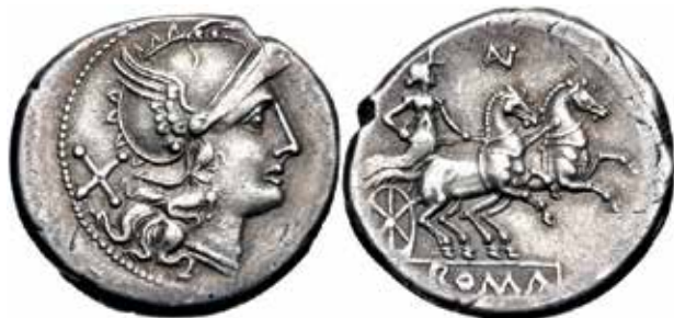
●□ 3: Anonymní denár (bigatus) 194–190 př. n. l., RRC 136/1.

Zároveň se staly inspirací pro řadu podobných mincovních typů zobrazujících další božstva ovládající velmi různorodá spřežení: Hérakla s bigou kentaurů, 7 Junonu v bize tažené kozami, 8 Jupitera s dvojspřežím slonů, 9 Cereru v bize vlečené hady 10 či právě Dianu v bize tažené jeleny.