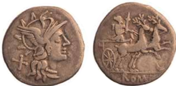
● □ 2: Anonymní denár 143 př. n. l., RRC 222/1.

Jedná se o anonymní denár datovaný do roku 143 př. n. l. s vyobrazením hlavy bohyně Romy na lici a s Dianou řídící bigu taženou dvěma jeleny na rubní straně. Bohyně má na zádech toulec šípů, pod kopyty zvířat se nachází symbol v podobě půlměsíce, v dolní úseči je umístěn nápis ROMA. Na dosud známých ražbách tohoto typu (obr. 2) Diana třímá v pravé ruce planoucí pochodeň a v levici opratě, na vzácné variantě však drží pochodně dvě – jednu v pravici a druhou zároveň s opratěmi v levé ruce.