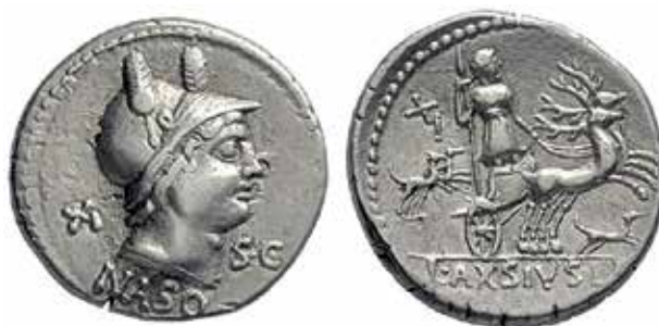
●□ 6: Lucius Axius L.f. Naso, denár 70 př. n. l., RRC 400/1a.