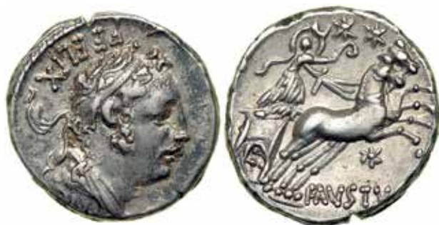
●■ 8: Faustus Cornelius Sulla, denár 56 př. n. l., RRC 426/2.