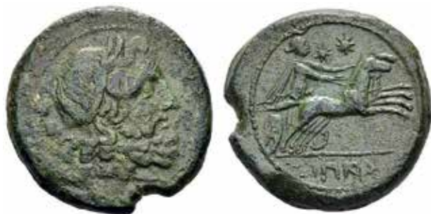
● 4: Kampánie, Kapua, biunx 216–214 př. n. l.

Zdroj: https://pro.coinarchives.com/a/lotviewer.php?LotID=1068039&AucID=2093&Lot=13 .