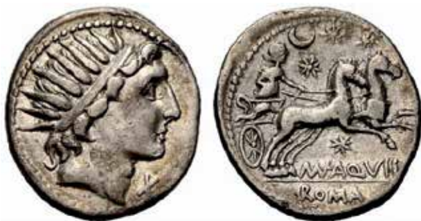
● □ 7: Mn. Aquilius, denár 109/110 př. n. l., RRC 303/1.

Tato inovace se však v římském výtvarném umění zjevně příliš neujala. Již zmíněné vytěsňování měsíčního aspektu v souvislosti s Dianou 37 a návrat k původnímu ikonografickému schématu prvních bigátů a jejich kampaňských předloh prezentovaný ražbami Mn. Aquilia (obr. 7) a Fausta Cornelia Sully 38 (obr. 8) zjevně dokládá sílu původní náboženské i ikonografické tradice, hluboce zakořeněnou představu Luny coby samostatného božstva a neochotu podřídit se řeckému vzoru a degradovat tuto mocnou měsíční bohyni jen na jeden z Dianiných aspektů.