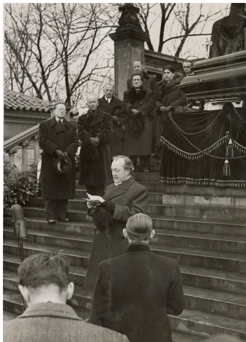
Obrázek 5 – Emil Axman pronáší projev při pohřbu Jana Kubelíka na vyšehradském hřbitově v Praze dne 10. 12. 1940

V archivu Národního muzea a v Axmanově pozůstalostním fondu uloženém v Českém muzeu hudby se nacházejí důležité písemnosti, které dokumentují průběh jeho zaměstnání v Národním muzeu z hlediska pracovního a platového zařazení. V Archivu Národního muzea je kromě jednotlivých dokumentů uložených v Registratuře Národního muzea zachován také jeho osobní spis, 10 který obsahuje tyto materiály: kopie některých osobních do-