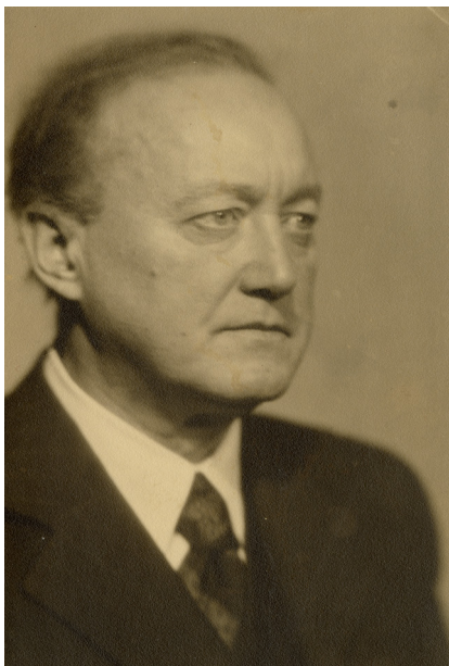
Obrázek 7 – Emil Axman – portrét, 40. léta. NM – České muzeum hudby, S 45/604.

Emil Axman zemřel 25. ledna 1949 ve věku 62 let po dlouhé a těžké nemoci, která měla počátek už v roce 1944, takže už nemohl dále rozvíjet tyto smělé plány. Do dneška však čerpáme z jeho odkazu. Pracujeme se sbírkami, které se mu podařilo pro muzeum získat. Pracujeme denně s evidenčními pomůckami psanými jeho rukou. Měli bychom ale systematicky shromáždit jeho zprávy o stavu oddělení, odborné posudky, korespondenci, které by nám ještě více přiblížily jeho práci. Bohužel nevíme moc o něm, jaký vlastně byl – pamětníci už zemřeli a nemáme se koho zeptat. Něco málo prozradí jeho korespondence (byl patrně introvertní povahy) nebo proslov ředitele Národního muzea Gustava Skalského (Axmanův nástupce po jeho rezignaci) při Axmanově pohřbu. 21 Skalský vyzdvihuje jeho oddanost, pečlivost, obezřetnost a statečnost za války při vedení knihovny. Vyzdvihuje jeho zásluhy na rozvoji hudební sbírky – ze skromných začátků systematicky vybudoval rozsáhlou a obsahově bohatou sbírku. Skalský si Axmana vážil jako kolegy a přítele, který byl vždy upřímný, přímý, čestný a spravedlivý, čistého a citlivého srdce a pravdivé povahy. Nikdy nikomu vědomě neublížil. Sloužil Národnímu muzeu, svému národu a své vlasti poctivě a bez postranních úmyslů a cílů a netoužil po slávě a zisku.