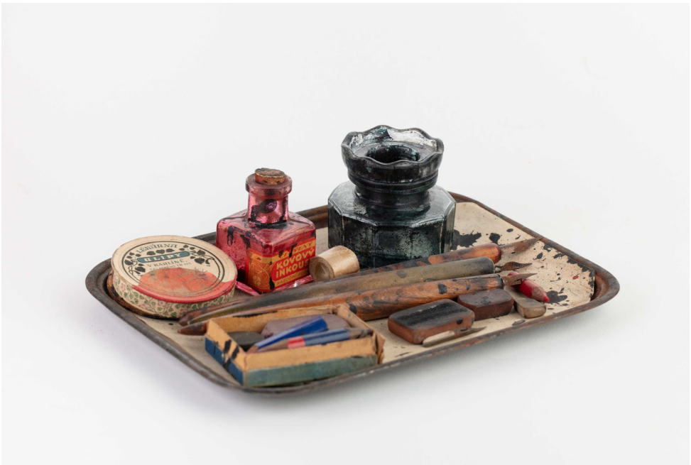
Obrázek 3 a 4 – Brýle Emila Axmana a jeho psací potřeby. České muzeum hudby.