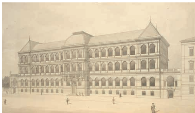
Obr. 4. Josef Schulz, Návrh budovy Umeleckoprůmyslového muzea (asi 1897/8), lavírovaná kresba, (nerealizovaná varianta).

oblíbený termín „rozluštění“ či „vyluštění“ prozrazuje architektovo zaměření na optimální uspokojení daných funkcí, utilitárních i duchovních, a na racionální analýzu daného úkolu. Součástí úspěšného řešení musel být vždy „vzájem mezi uměleckými a praktickými požadavky“, 23 což znamenalo především, aby „stavitel [...] jednoduše a levně svým stavbám vnady půvabnosti dodatí dovedl“. 24