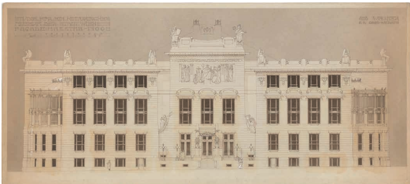
Obr. 5. Otto Wagner, Kaiser Franz Josef-Stadtmuseum Wien, tzv. agitační projekt (nerealizováno), fasáda (1900).

Karel B. MÁDL, Umění výtvarná, in: Památník na oslavu padesátiletého panovnického jubilea Jeho Veličenstva císaře a krále Františka Josefa I., Praha 1898.