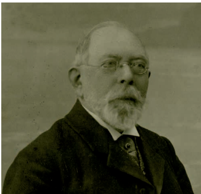
Obr. 1. Neznámý fotograf, Josef Schulz, ateliérový portrét (1915). Zdroj: ANM, Josef Schulz, inv. č. 785.

dramatikou úpadků, otřesů, bloudění i pokusů o nové úrovně a směry, nevyrušen ze svého sobecky spokojeného soukromí. 3 Ortel, který nad Schulzem v jeho nekrologu ze září 1917 vyslovil kritik Karel B. Mádl, se pak stal obrazně řečeno hřebíkem do rakve národního velikána: „Schulz byl duch veskrze konservativní a tkvěl na jednom bodu. Nedopřál sluchu novým hlasům a skloněn nad rýsovkou, dbal vyzkoušených nebo spíš osvědčených forem a měl větší zřetel k symetrii a výhledovosti nežli k vnitřním příkazům moci účelné.“ 4