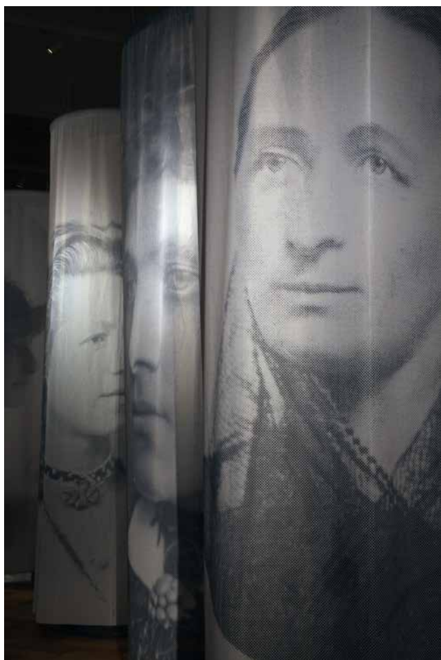
Obr. 4. Postavy v prostoru prvního sálu.

čeno, vymezili několik základních dobových rámců, ve kterých se postavy pohybovaly. První sál představoval období dlouhého 19. století. Druhý, menší sál pak kontext první Československé republiky, přes spojovací chodbu (protektorát Čechy a Morava) návštěvníci vstupovali do třetího, velkého sálu – procházeli obdobím státního socialismu směrem k současnosti. Řada postav by se teoreticky mohla nacházet ve více dobových kontextech (sálech), zasadili jsme je do toho, ve kterém jsme viděli těžiště jejich působení.