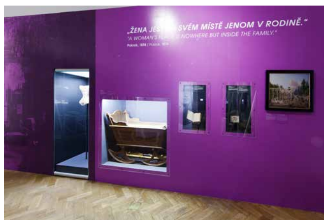
Obr. 11. Přední stěna prvního sálu výstavy – znázornění genderového řádu dlouhého 19. století.

deformace ženského těla, jaké vznikaly v důsledku nošení korzetů). Dětská kolébka reprezentovala mateřství; v tomto případě jsme poukazovali také na to, že v rámci českého národního hnutí – v kontextu nedominantního postavení českého národa v monarchii – byly mateřství a zejména výchova dětí vnímány nejen jako základní atributy soukromé role ženy, ale jako úlohy „veřejné“, úkoly národního významu. 24 Taštička na peníze Marie Riegrové-Palacké, umístěná v další z ník v přední stěně, zastupovala charitativní práci jako způsob „vykročení“ ženy do veřejného prostoru, který byl pozitivně přijímán a v určitých prostředích očekáván. 25 Mohli bychom říct, že šlo o jakési „vykročení–nevykročení“, žena sice působila mimo hranice domácnosti, zároveň její práce nebyla finančně ohodnocena, byla činností „pro druhé“, jakousi formou „kolektivního mateřství“ – žena zde nebyla matkou pouze svým dětem, ale všem potřebným.