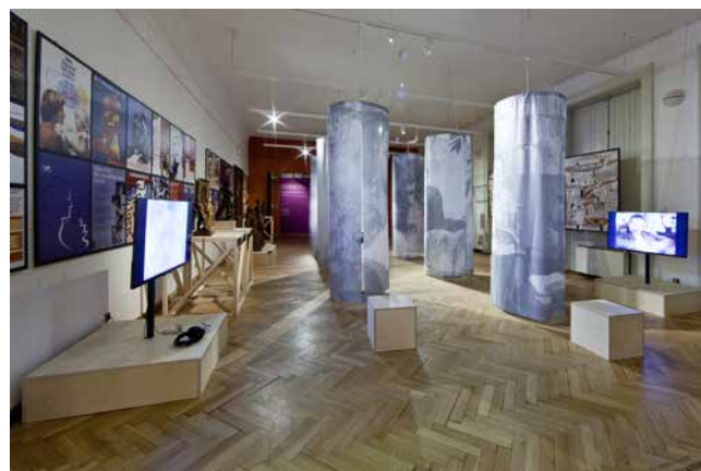
Obr. 30. Pohled do třetího sálu ze zadní strany.