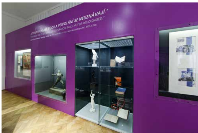
Obr. 21. Předměty umístěné po stranách sálu zachycovaly normy ženskosti a genderový řád meziválečného období. V horní části zachycené stěny je vidět § 106 ústavy z roku 1920: „ Výsady rodu, pohlaví a povolání se neuzŇávají. “

tedy říct, že postava Ludmily Šimáčkové na výstavě reprezentovala pojetí ženské emancipace jako času a prostoru pro sebe sama .