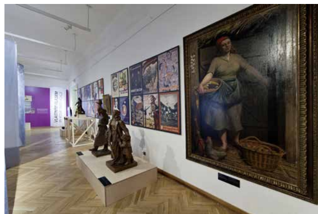
Obr. 27. Pohled na pravou boční stěnu posledního sálu, ukazující četné obrazy socialistické „nové ženy“ v oficiálním umění a kultuře.

Většina z postav v tomto sále zastupovala novou generaci žen, narodila se kolem roku 1900 nebo po něm a do nové republiky vstupovala s nadějí, že zde bude moci plně rozvinout svůj potenciál. Předměty, které každou z postav reprezentovaly, naznačovaly různorodé cesty, jimiž se toto