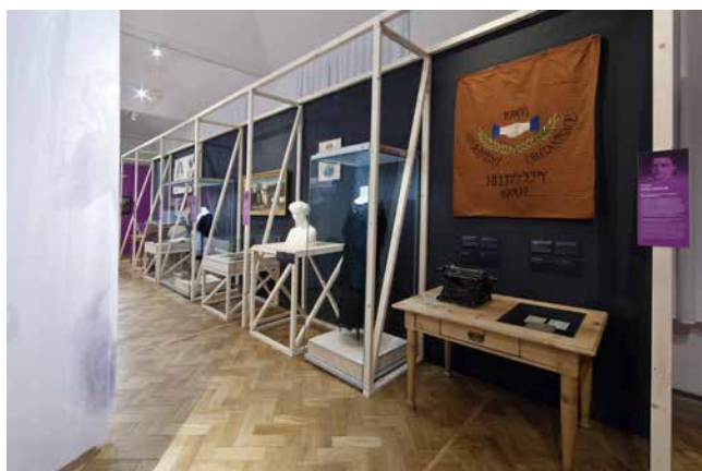
Obr. 17. Prostory postav v prvním sálu. V popředí „prostor“ Karly Máchové.