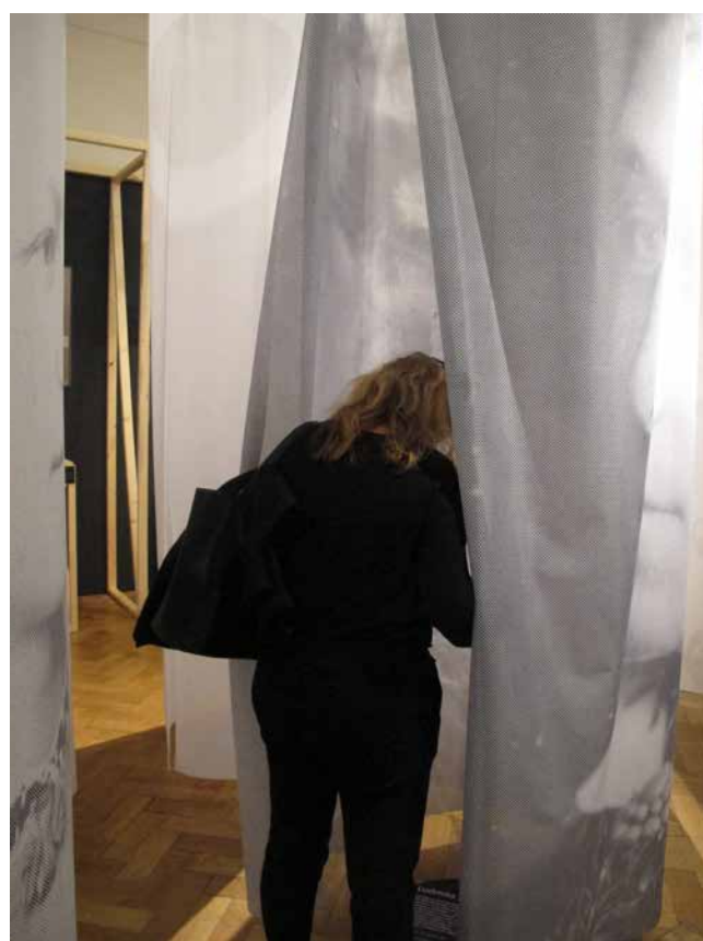
Obr. 9. Návštěvnice vchází do baldachýnu – vstupuje „do hlavy“ („do kůže“) postavy.

val veřejný prostor jako mužský, domácnost a rodinu jako doménu ženy, která měla být především matkou, manželkou a hospodyní. Zároveň byly normy a zejména pak realita žen (i mužů) významně ovlivněny kategoriemi národa a sociální vrstvy. Grafika stěny (ve fialové barvě) pracovala s velkoformátovou dobovou fotografií ženy 23 sedící v přítmi měšťanského pokoje. Toto vyobrazení zde reprezentovalo měšťanský ideál femininity 19. století – ideál ženy „soukromé“, který zároveň zdaleka neodpovídal realitě života velké části žen v této době. Výběr předlohy, jež nebyla příliš kva-