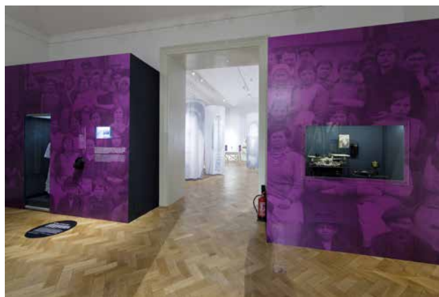
Obr. 19. Zadní stěna prvního sálu věnovaná první světové válce, zachycující válečný prožitek zejména dělnických žen.