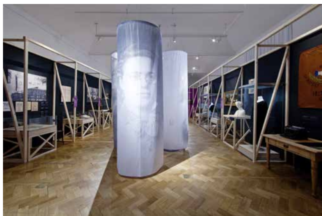
Obr. 16. Pohled na první sál ze zadní strany. V popředí postava Karla Máchová.