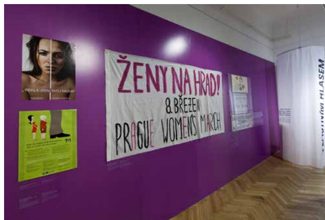
Obr. 31. Část poslední (zadní) stěny třetího sálu – závěr výstavy.

V souvislosti s výročím volebního práva žen jsme uspořádali také procházku po Praze po stopách sufražistek 70 a ve spolupráci s Národním filmovým archivem (NFA) zorganizovali v pražském kině Ponrepo večer s promítáním dobových i současných filmů o boji za volební právo žen spolu s diskusí s odbornicemi. 71 Spolu s NFA jsme připravili také filmový cyklus na téma „Ženská emancipace v českém a československém filmu“. 72 Uskutečnil se též, do posledního místa zaplněný, koncert Sboru a orchestru Univerzity Karlovy, který v Českém muzeu hudby provedl známá i zapomenutá díla hudebních skladatelek. Tématu postavení žen v období socialismu se věnovala přednáška spoluautorky