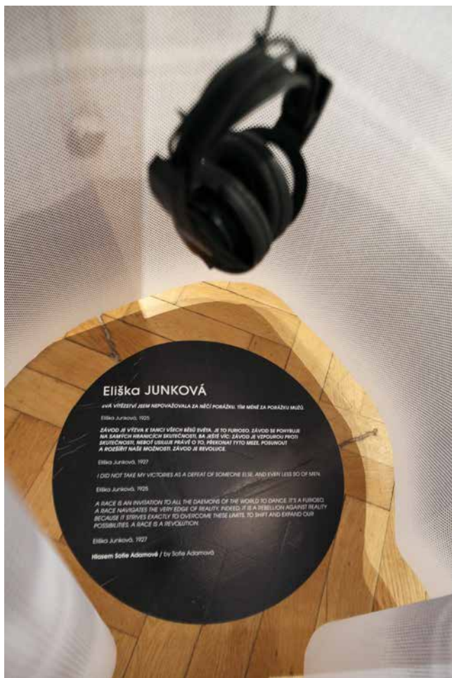
Obr. 10. Uvnitř baldachýnu. Přepis promluvy postavy v češtině i angličtině byl zároveň nalepen na zemi – pro neslyšící návštěvníky a návštěvnice a ty, kteří nerozuměli češtině.

deformace ženského těla, jaké vznikaly v důsledku nošení korzetů). Dětská kolébka reprezentovala mateřství; v tomto případě jsme poukazovali také na to, že v rámci českého národního hnutí – v kontextu nedominantního postavení českého národa v monarchii – byly mateřství a zejména výchova dětí vnímány nejen jako základní atributy soukromé role ženy, ale jako úlohy „veřejné“, úkoly národního významu. 24 Taštička na peníze Marie Riegrové-Palacké, umístěná v další z ník v přední stěně, zastupovala charitativní práci jako způsob „vykročení“ ženy do veřejného prostoru, který byl pozitivně přijímán a v určitých prostředích očekáván. 25 Mohli bychom říct, že šlo o jakési „vykročení–nevykročení“, žena sice působila mimo hranice domácnosti, zároveň její práce nebyla finančně ohodnocena, byla činností „pro druhé“, jakousi formou „kolektivního mateřství“ – žena zde nebyla matkou pouze svým dětem, ale všem potřebným.