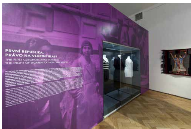
Obr. 23. Záběr z obecních voleb v roce 1931 na polepu stěny připomíná zásadní změnu, ke které v době první republiky došlo, ženy se staly politickými subjekty.