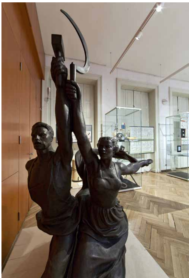
Obr. 26. Sousoší Dělník a kolchoznice od Věry Ignatěvny Muchinové, 50. léta 20. století. Jde o bronzový model gigantického pomníku z roku 1937 nacházejícího se v Moskvě.

politických stran – o jejich hlasy se strhla bitva, 47 což jsme ukazovali pomocí volebních plakátů, kterými různé politické strany na voličky cílily.