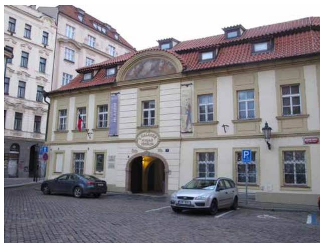
Obr. 1. Dům u Halánků, sídlo Náprstkovského muzea.

Zapojení postav nám umožnilo představit téma poutavou formou a zároveň s tím nerezignovat na jeho komplexnost: Konkrétní ženy, resp. postavy ve výstavě nevystupovaly pouze „samy za sebe“, ale zároveň reprezentovaly určité typy situací, voleb a cest, kterými se – vedle nich nebo v návaznosti na ně – vydávaly také další ženy. Volbou po-