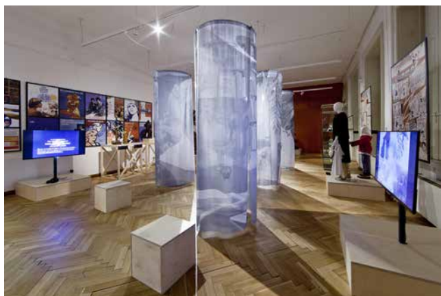
Obr. 30. Pohled do třetího sálu ze zadní strany.

stavení žen v současné společnosti, podělit se o problémy, které trápí je, stejně jako o své dojmy z výstavy, podat nám zpětnou vazbu.