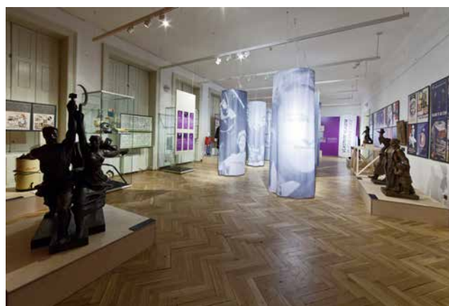
Obr. 25. Vstup do třetího, posledního sálu – do období státního socialismu.