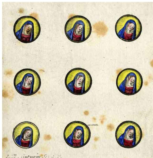
Obr. 6. Polykací obrázky si lidé nosili z různých poutních míst. Používaly se zejména k léčení nemocných. Obrázek se oddělil a namočil do vody k pití či zapekl do jídla. KNM, oddělení knižní kultury, fond Bedřich Přibíl.