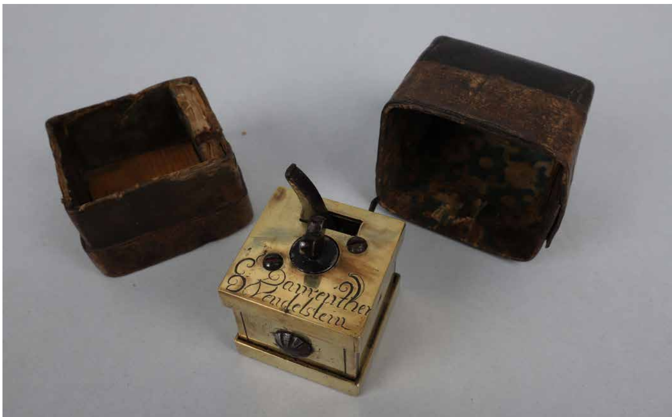
Obr. 4. Mechanismus na prořezávání kůže pro přikládání baněk. Podobně jako pouštění žilou či přikládání pijavic měl i tento nástroj sloužit k odvedení „zkažených šťáv“. Historické muzeum, Etnografické oddělení.