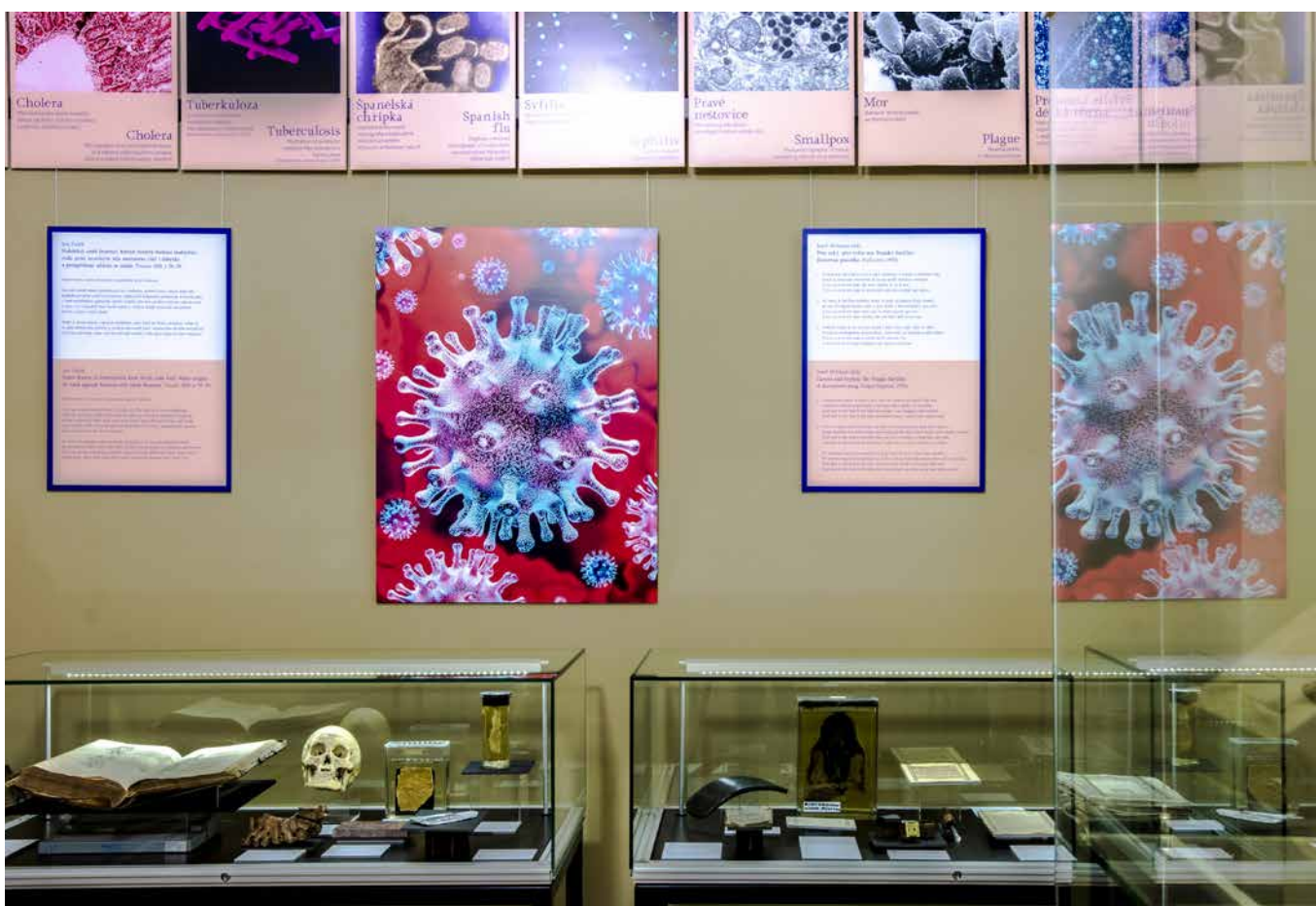
Obr. 10. Záběr do výstavy se zvětšeninami patogenů.