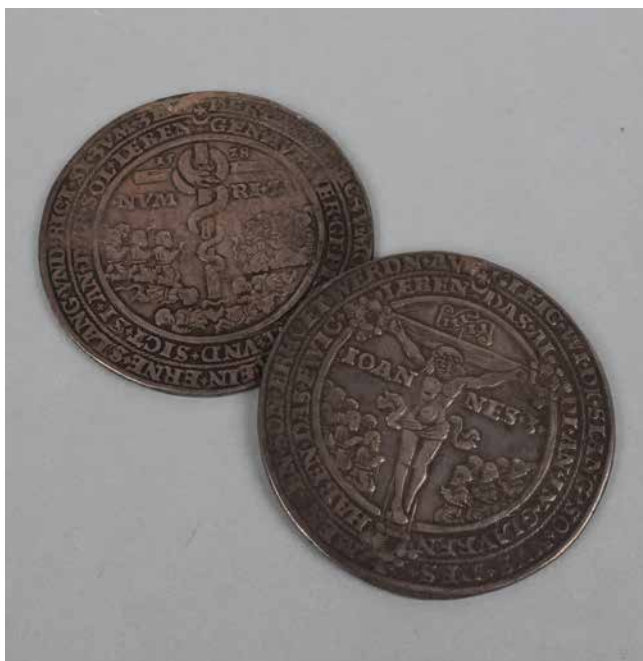
Obr. 5. Morový tolar, 1528, Jáchymov. Takzvané morové tolarý jsou výrazným prvkem medailérství 16. století. Představený tolar pochází z produkce krušnohorského česko-saského regionu s převažujícím saským protestantským vlivem. Historické muzeum, Numismatické oddělení, sbírky Františka Rudolfa a Karla Chaury.