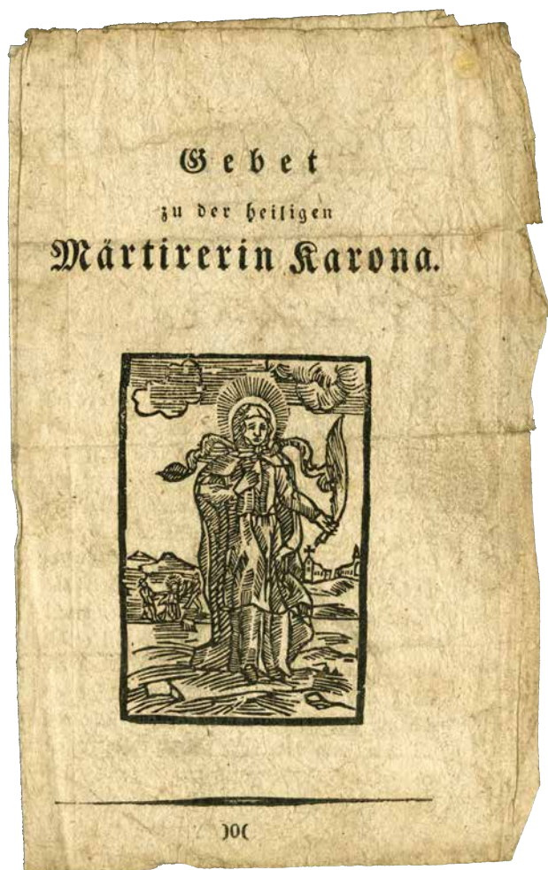
Obr. 2. Gebet zu der heiligen Märtyrerin Korona , [první polovina 19. století]. Německá modlitba ke sv. Koroně za pomoc v nouzi a trápení. Titulní dřevorez s vyobrazením svaté Ludmily. KNM, oddělení knižní kultury, fond Modlitby.

byla vnímána v 18. a 19. století ve střední Evropě, tedy jako ochránčynie a pomocnice chudých, ale také jako obskurní pomocnice hledačů pokladů či jiného způsobu rychlého zbohatnutí. Žádná expozice se neobejde bez vizuálně přitažlivých předmětů. Bohužel sv. Korona nepatřila mezi často zobrazované svěťice. KNM představila především tištěné modlitby, které zaujmou úvodní ilustrací. Jejich producenti se obvykle snažili srazit cenu tisku a zřídka kdy nechávali vytvářet nové štočky pro konkrétní zakázku. Proto není výjimkou, že tisky obsahující modlitby ke svaté Koroně mají na titulní ilustraci jiné svěťice, případně vyobrazení Panny Marie. Pokud je sv. Korona vyobrazena na titulní ilustraci, máme většinou možnost zhlédnout její poněkud kuriózní umučení. Muzeum v Poličce zapůjčilo na výstavu reliéf z dílny Vojtěcha Eduarda Šaffa, mimo jiné autora soch „Země“ a „Vzduchu“ na balustrádě Národního muzea. Jedná se o přípravnou studii z cyklu vídeňských pověstí ukazující svěťici v neobvyklém zobrazení pomocnice při nalezení pokladu.