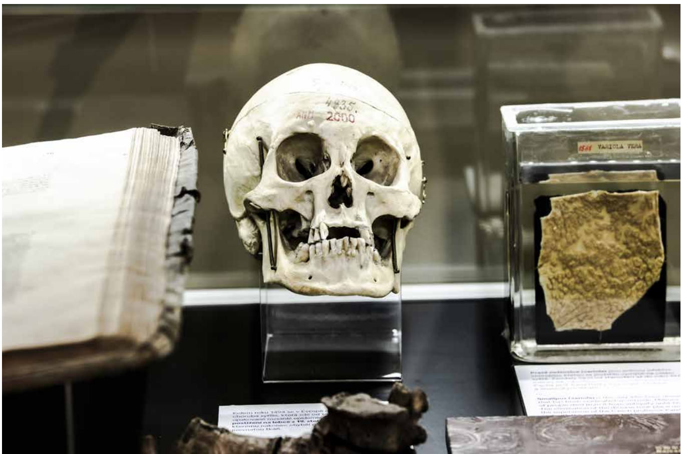
Obr. 8. Záběr do výstavy se syfilitickou lebkou a tekutinovým preparátem pravých neštovic. Přírodovědecké muzeum, antropologické oddělení.