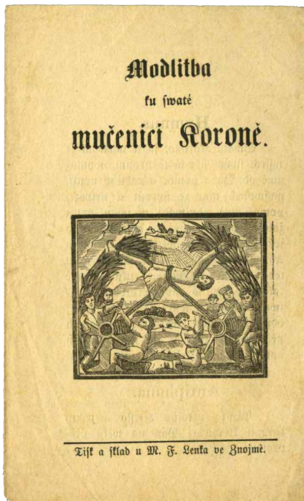
Obr. 11. Modlitba ku svatě mučenicí [sic] Koroně , M. F. Lenk, Znojmo, [1857–1880?]. Tento tisk s vyobrazením umučení sv. Korony na výstavě nenajdete. Byl objeven až po jejím zahájení při katalogizaci nových přírůstků. KNM, oddělení knižní kultury, fond Modlitby.

divák pozvedne zrak ještě výše, uvidí linii dat vybraných epidemií, která demonstrovuje všudypřítomnost hromadných nemocí v průběhu celé naší existence a v důsledku zeslabuje výjimečnost současné nákazy.