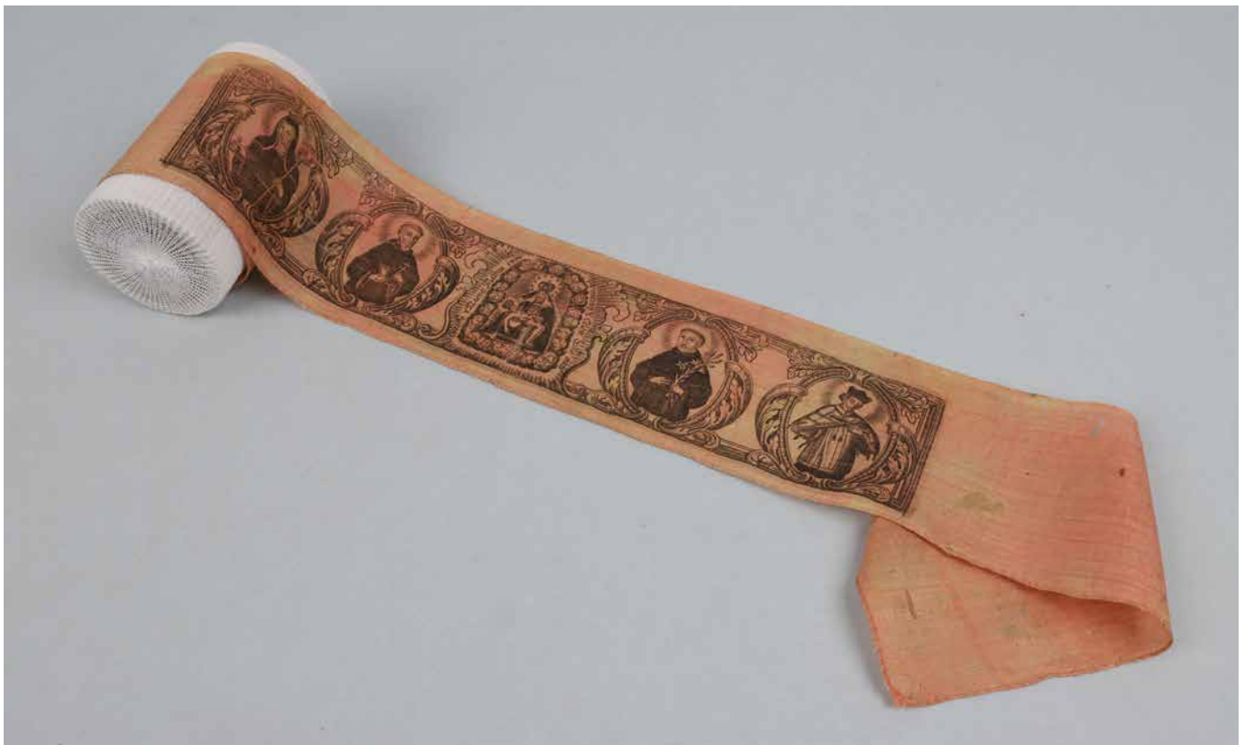
Obr. 7. Morová stuha s vyobrazeními svatých ochránců proti moru, [18. století]. Měla být nošena ideálně přímo na těle. Historické muzeum, Etnografické oddělení.