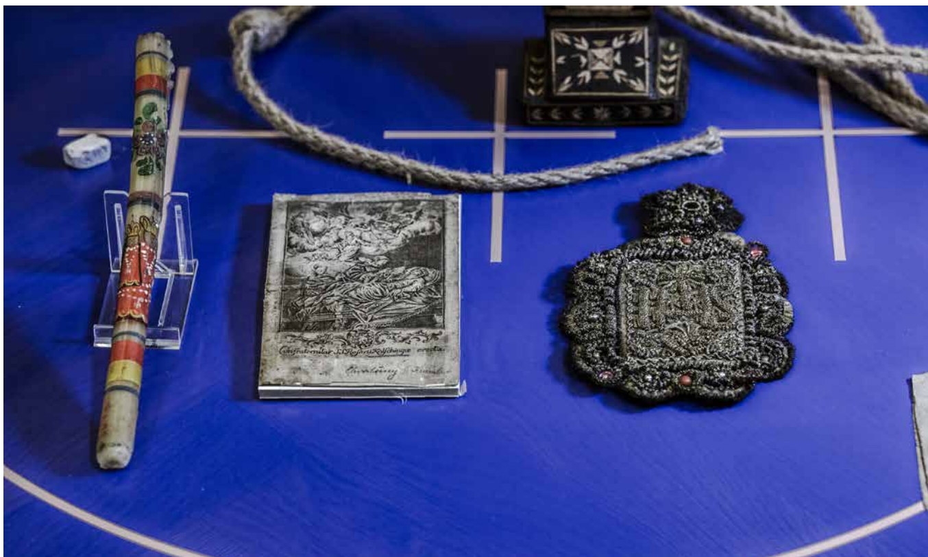
Obr. 9. Záběr do výstavy s předměty potřebnými k vyvolání pomoci sv. Korony při hledání pokladu.