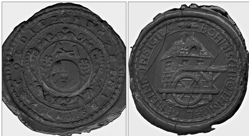
Obrázek 9 – Pečeť obce Choltice s mlýnským kamenem s kypřicí, nad ním oškrt přeložený mlátkem. Archiv Národního muzea, Eichlerova sbírka, neinv.