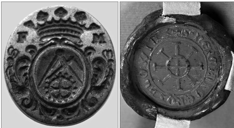
Obrázek 7 – Osobní mlynářská pečeť s iniciálami F. M. Vlastivědné muzeum Kyjov, pobočka Masarykova muzea v Hodoníně, inv. č. E 97-8.