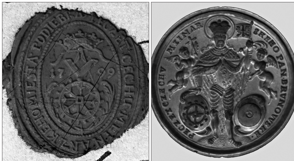
Obrázek 5 – Přitíštěná pečeť cechu mlynářů v Poděbradech na listině z roku 1830, typář z roku 1799. Státní okresní archiv Nymburk se sídlem v Lysé nad Labem, fond Cech pekařů, krupařů a mlynářů Poděbrady, inv. č. 4.