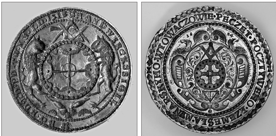
Obrázek 3 – Typář cechu mlynářů v Trutnově z roku 1513. Státní okresní archiv Trutnov, fond Cech mlynářů Trutnov, nein.v.