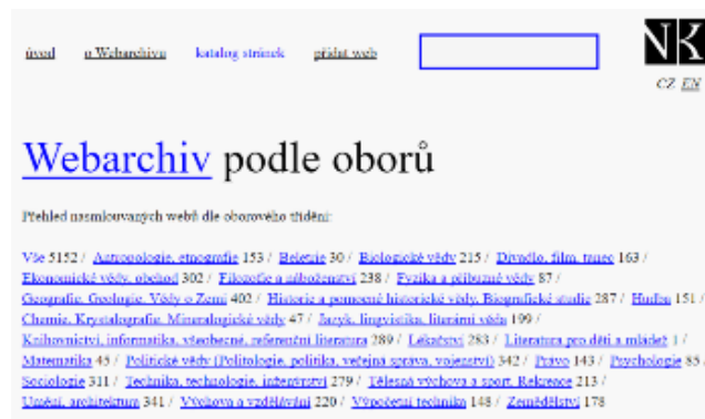
Obrázek 1: Katalog stránek řazených podle Konspektu. Zdroj: Webarchiv [online]. [cit. 2017-07-24]. Dostupné z: https://www.webarchiv.cz/cs/katalog-stranek

Hlavním cílem webových archivů je uchovávat webový obsah. Co však má být archivováno? Veškerý internet archivovat nemohou. Na co by se měly tedy webové archivy, které jsou mnohdy limitovány technicky i finančně, zaměřit? Webarchiv, který patří k nejstarším v Evropě, se coby součást Národní knihovny České republiky soustředí na archivaci národního webu. Cílí na unikátní elektronické dokumenty s dlouhodobou kulturní, vědeckou či historickou hodnotou, které mají bohemikální charakter – ať už z hlediska místního vymezení (publikované na území České republiky), jazyka (v češtině), autorství (autoři původem z Česka) nebo obsahu (pojednávající o České republice). Přístup Webarchivu konvenuje proměňující se strategii webových archivů obecně. Ve své akviziční politice tak kombinuje obě v úvodu naznačené linie. Ve snaze postihnout co nejkomplexněji český web provádí jednou až dvakrát ročně tzv. celoplošnou sklizeň. Jedná se o automatický sběr dat, kdy díky dlouholeté spolupráci s národním správcem české domény CZ.NIC archivuje všechny webové stránky s národní doménou *.cz, a představuje otisk českého webu v danou chvíli.